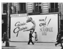
Ilse Bing Sondaria, 1947. Victoria and Albert Museum, London.