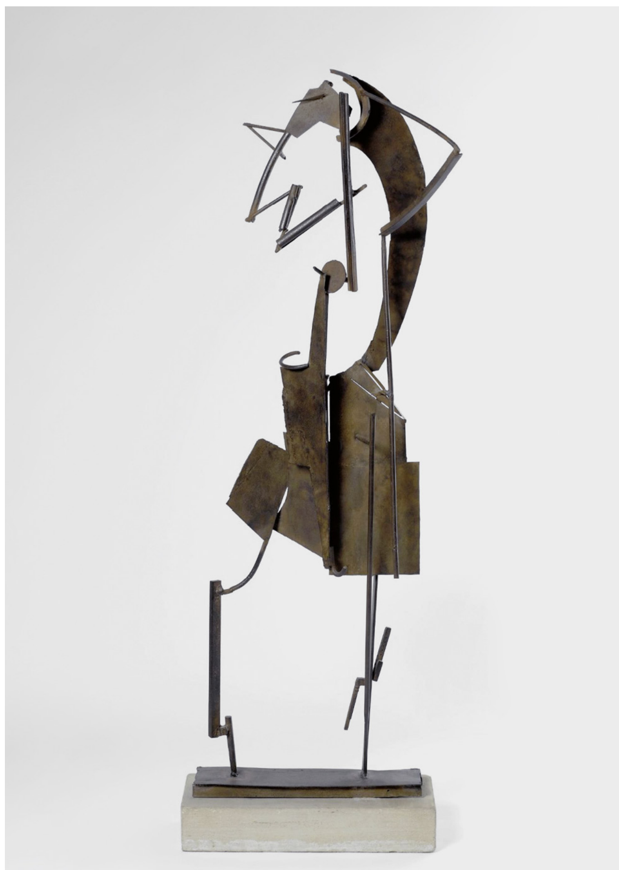
Pablo Picasso Mujer en el jardín , París, primavera de 1930 Hierro soldado y pintado de blanco 206 × 117 × 85 cm Musée National Picasso-Paris © Sucesión Pablo Picasso. VEGAP, Madrid, 2022