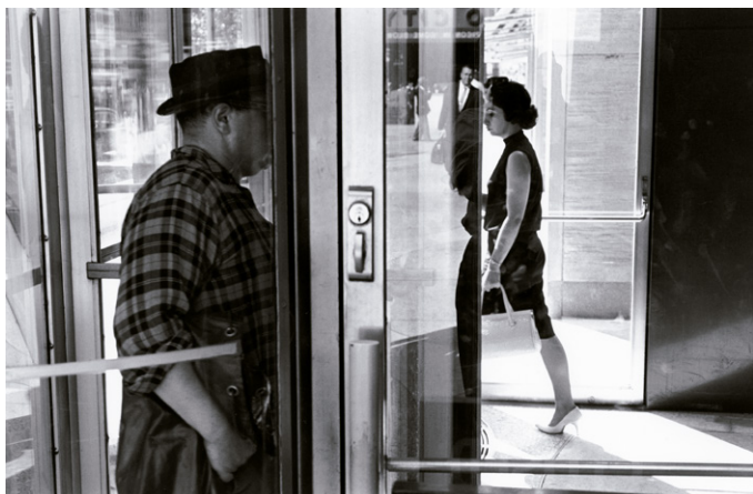
Lee Friedlander, Nueva York , 1963. Cortesía del artista y de Fraenkel Gallery, San Francisco