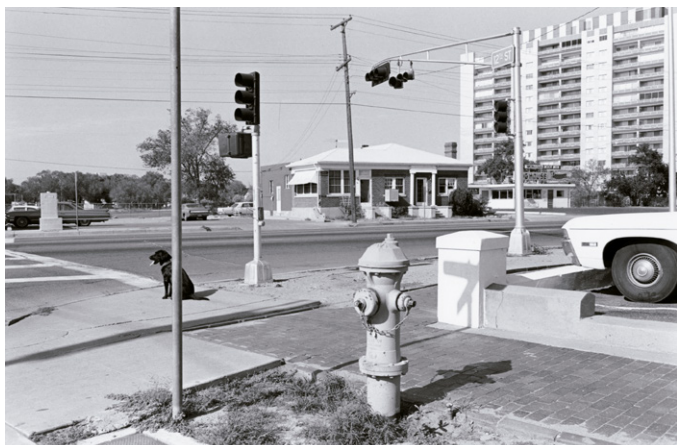
Lee Friedlander, Albuquerque , Nuevo México, 1972.

escaparates o la composición de escenas como si de collages se tratara son algunas de las constantes que configuran su marca de autor, la personal voz que habla en sus imágenes.