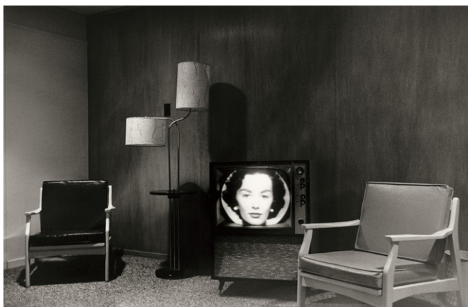
Lee Friedlander, Nashville, 1963.

En una ocasión, Lee Friedlander dijo: «Tiendo a fotografiar las cosas que se encuentran frente a mi cámara». Y esto es lo que ha hecho el artista durante más de seis décadas, creando una extensísima y variada obra que refleja la mirada que tiene sobre su mundo, que es también el nuestro.