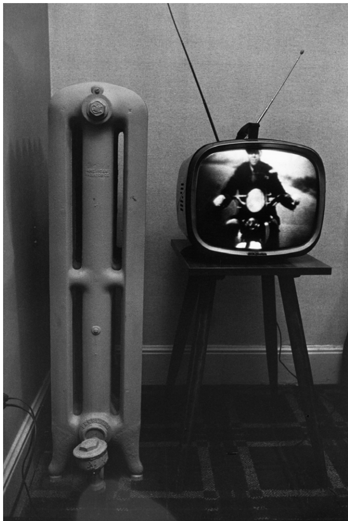
Lee Friedlander, Nashville , 1963. Cortesía del artista y de Fraenkel Gallery, San Francisco