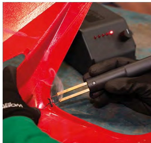
► Soldadura de plástico con grapas

o retención suplementarios (conjuntos de airbags y pretensores de los cinturones de seguridad), y de otros dispositivos electrónicos, tales como sensores o unidades de control, que influyen en el coste de reparación, frente al valor de mercado del vehículo.