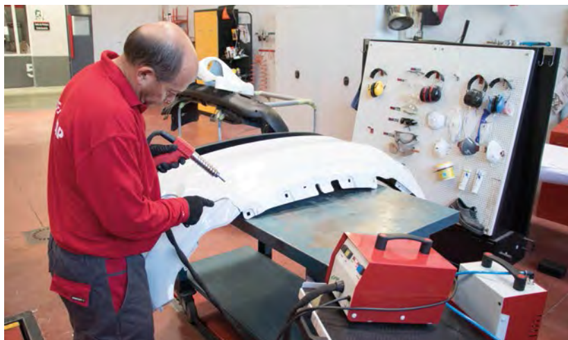
► Reparación de plástico