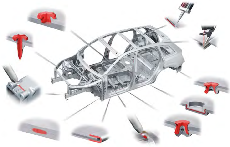
► Distintos tipos de uniones

Desde el principio, la soldadura es el proceso de reparación y unión que ofrece los mejores resultados en la reparación de piezas de plástico termoplástico.