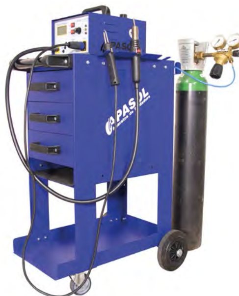
► Equipo de soldadura de nitrógeno

Desde sus inicios, nuestro taller se ha dispuesto como un auténtico "laboratorio", dotado con los mejores medios y donde los turismos han sido y siguen siendo