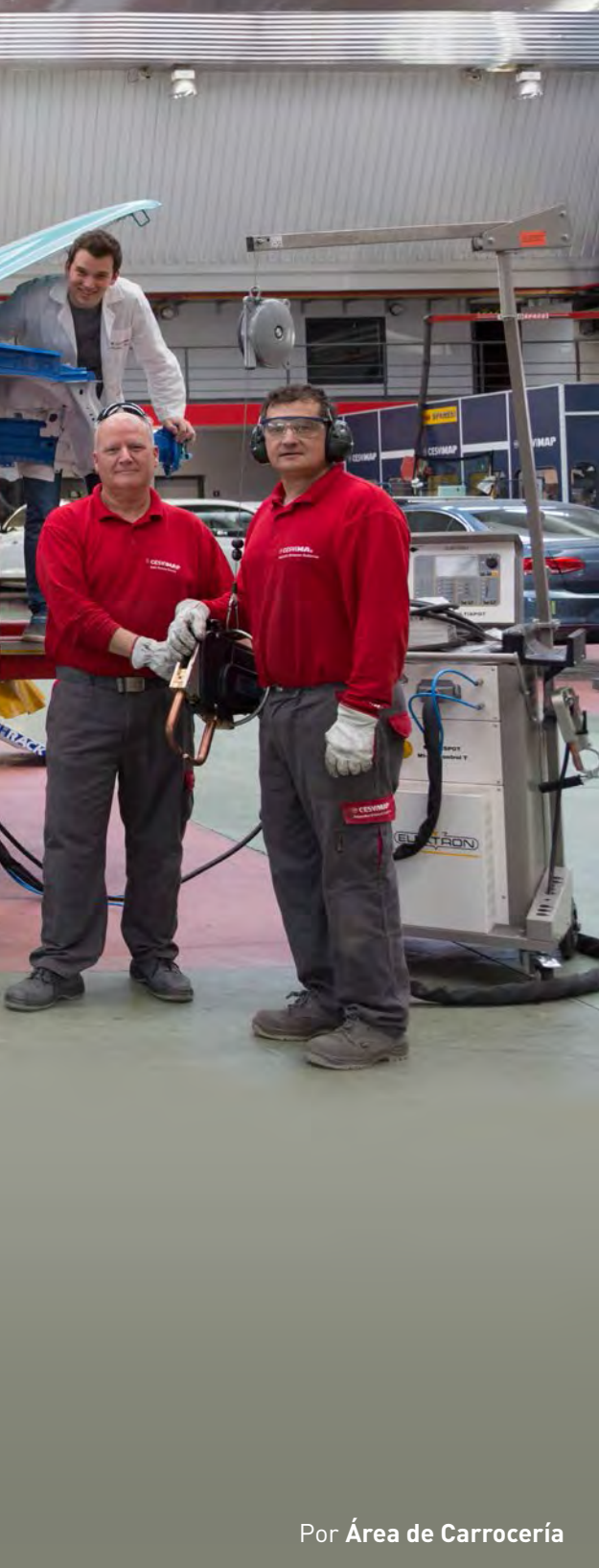
Por Área de Carrocería

Los procedimientos de trabajo sobre los turismos han sido, en muchas ocasiones, punto de partida y referencia para una gran parte del sector, así como del estudio de otros tipos de vehículos, acometido en CESVIMAP, y han tenido su reflejo en estas páginas.