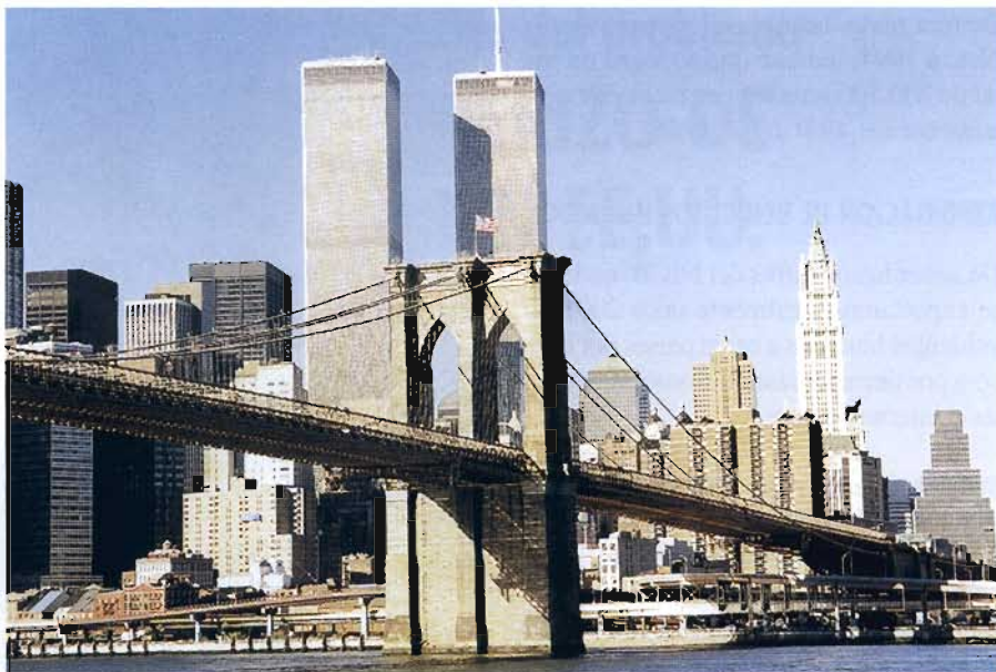
Las ciudades con acceso fácil a puertos y fronteras se han convertido en importantes mercados para el hurto y exportación de vehículos.

El objetivo principal es brindarle asesoría profesional y colaboración a los profesionales del área que carecen de la experiencia o recursos necesarios para enfrentar este delito. Consideran que el mecanismo más efectivo es la cooperación y, en este sentido, ofrecen una amplia gama de servicios a sus afiliados en el área de desarrollo técnico, capacitación, tendencias, inteligencia y asistencia en investigaciones. La amplia red de afiliados y contactos asegura que se cuente con la mayor cantidad posible de información para resolver prácticamente cualquier problema relacionado con hurto de vehículos.