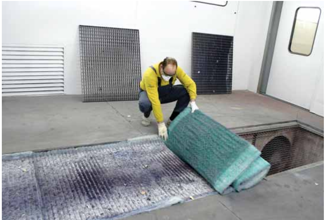
Los filtros previenen de la expulsión de partículas de pintado a la atmósfera