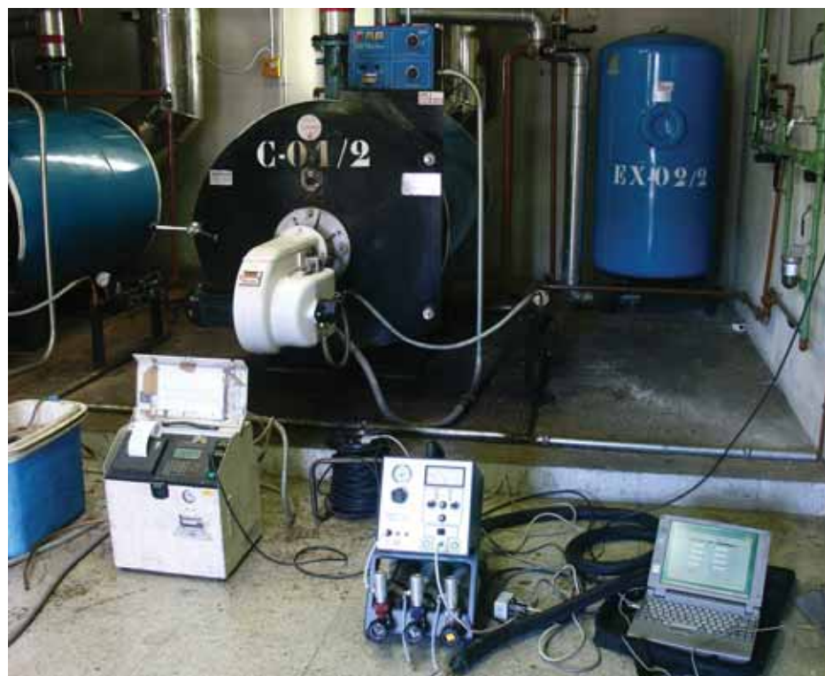
Equipos para la medición de contaminantes en proceso de combustión

Con los datos que refleja la tabla se puede concluir que, en la actividad de renovado del acabado del vehículo, el taller queda sin grupo, ya que el límite establecido es muy alto. Sin embargo, por los procesos de combustión, dependiendo del número de cabinas de pintura y de su potencia térmica nominal así como de las calderas