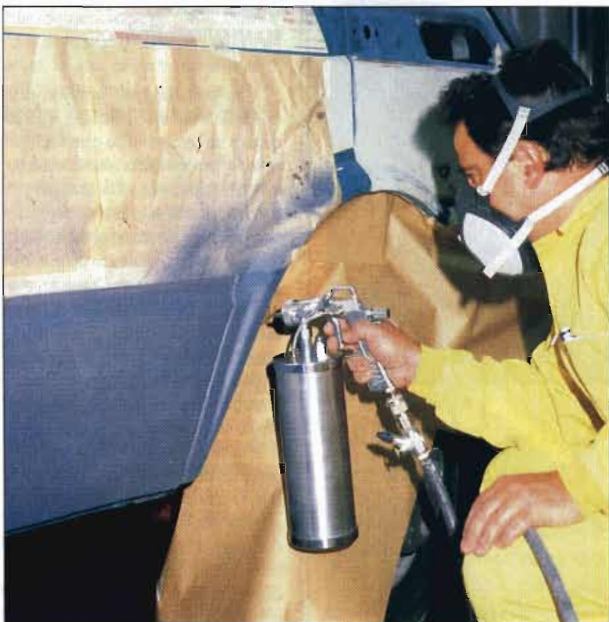
Aplicación de antigrilla.

- Para cualquier manipulación de la pistola, debe ser desconectada de la red de aire comprimido.