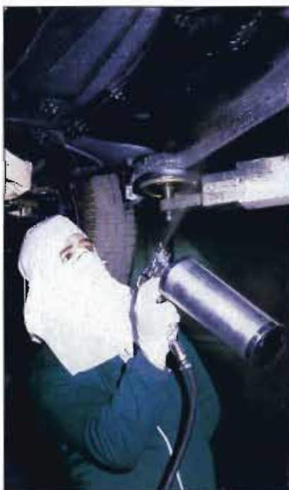
Aplicación de protector de bajos en un vehículo.

Debe tenerse la especial precaución de establecer una unión íntima pistola-recipiente, a fin de evitar fugas de producto.