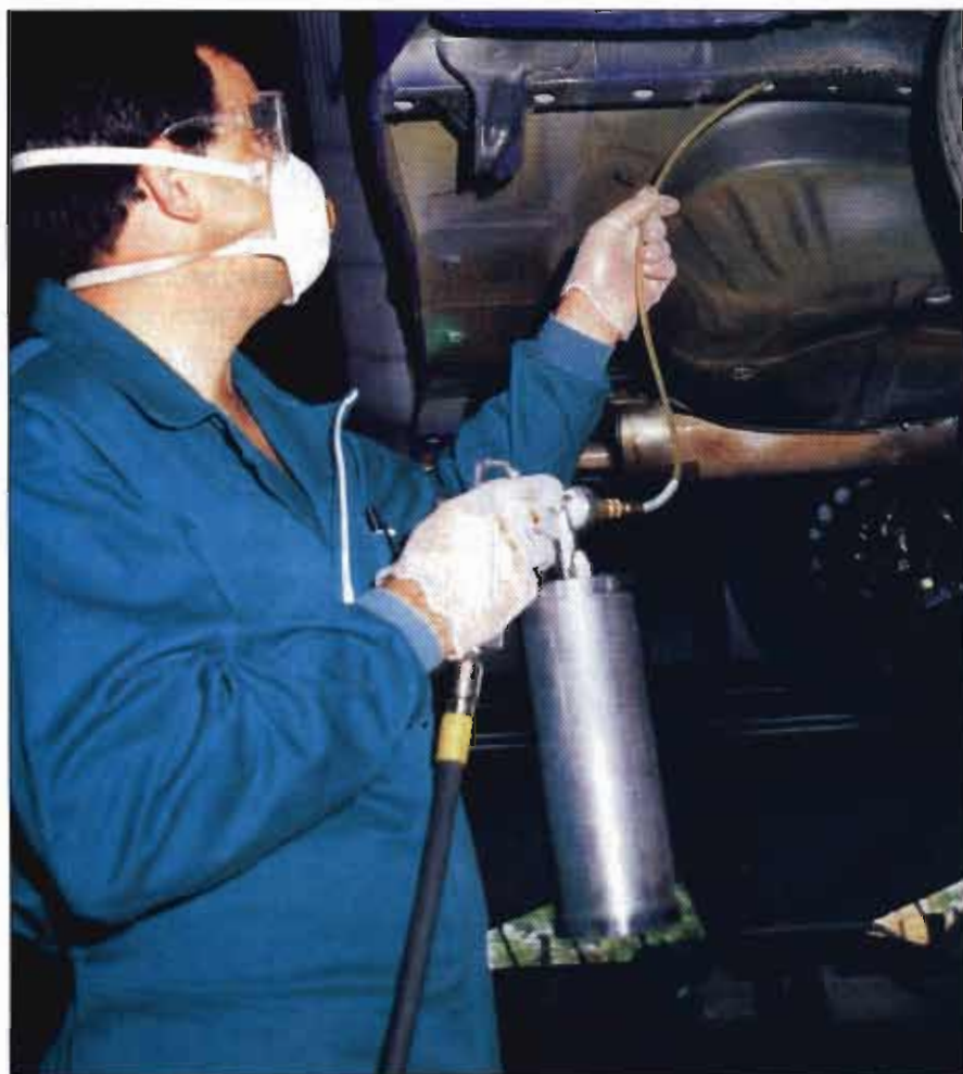
Aplicación de cera de cavidades en un cuerpo hueco.

un abanico de 90° para zonas semicerradas, como las puertas.