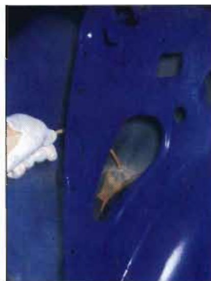
Detalle de boquilla de aspersión volumétrica.

El acabado final se conseguirá conjugando debidamente cantidad de producto, abertura de abanico, velocidad y distancia de aplicación.