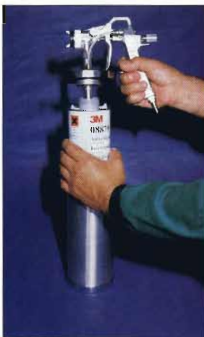
Preparación de la pistola.

El mando de regulación de abanico ajustará su abertura, evitando pulverizados inadecuados y rebotes o falta de adherencia de las partículas.