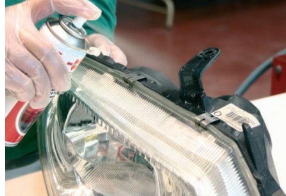
Reparación mediante adhesivo y malla de refuerzo