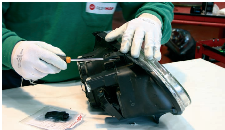
Empleo de un juego de patillas para la reparación

Estas reparaciones no suponen una pérdida de la calidad estructural del faro