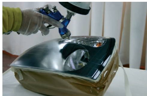
Aplicación del barniz