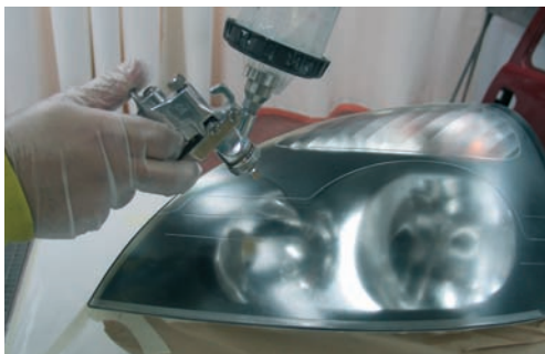
Aplicación de imprimación

Los daños más frecuentes son arañazos en la pantalla de dispersión y rotura de las patillas