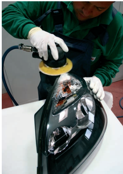
Lijado de la superficie

El proceso de recuperación comienza por medio del lijado de la superficie rayada, utilizando lijas de diferentes granos, en función de la profundidad del daño (P800 para rayas superficiales y P400 para las más profundas, hasta eliminar la raya totalmente). Para eliminar progresivamente las marcas del lijado anterior se irán alternando granos de lija cada vez más finos hasta terminar con P1500-P2000. El lijado se puede realizar a mano o con lijadoras con platos de discos que se adapten a la superficie a lijar.