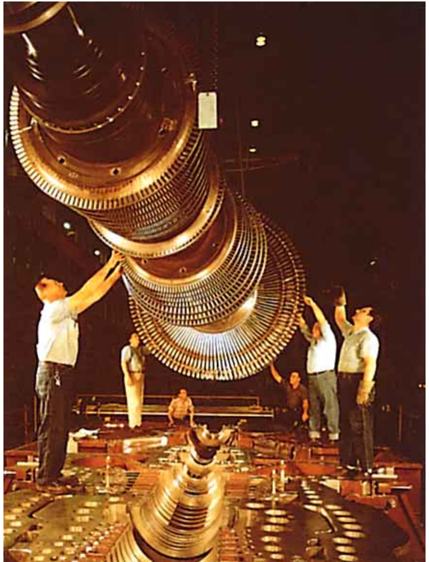
La Directiva Marco 89/391/CEE, establece las medidas para promover la seguridad y salud de los trabajadores.

Pasaremos a continuación a enumerar y analizar las Directivas derivadas del artículo 118, a), conocidas como las de Seguridad y Salud, cuyo máximo exponente sería la Directiva 89/391/CEE, porque, como ya hemos dicho, son las que más nos interesan, ya que establecen medidas de protección y prevención en los lugares de trabajo, fijando, además, los mínimos a respetar por nuestra legislación.