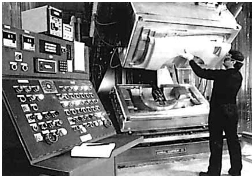
La seguridad integrada debe de estar presente en todas las decisiones concernientes a las empresas.