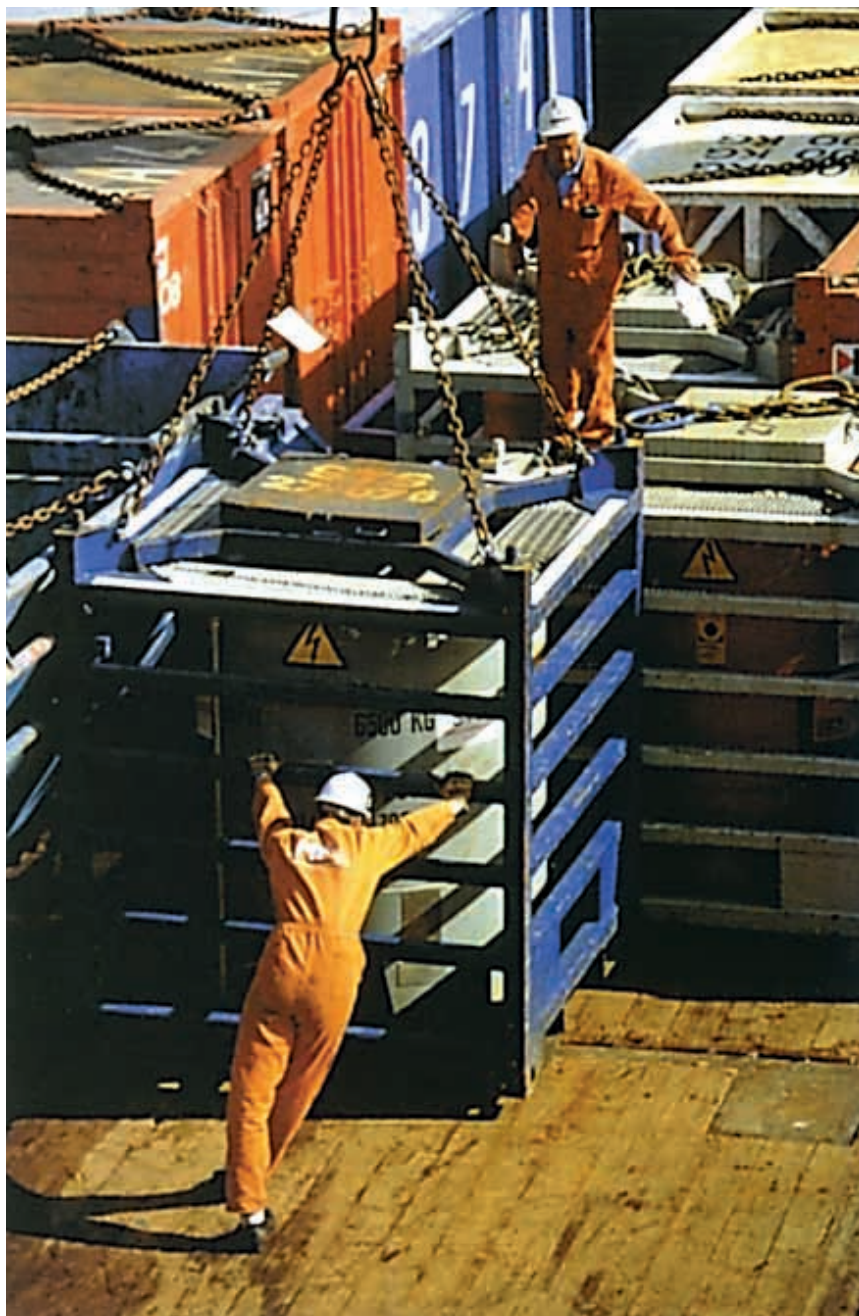
Las directivas establecen las medidas de protección y prevención en los lugares de trabajo, fijando los mínimos a respetar por nuestra legislación.

Por un lado, se pretenderá situar en el mercado sólo productos que tengan un nivel adecuado de seguridad, de modo que únicamente se puedan comercializar o situar en el mercado de los Estados miembros los productos con una seguridad in-