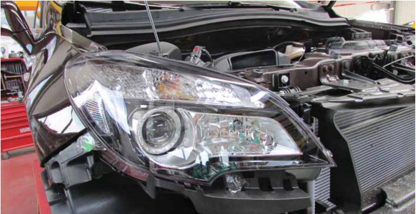
► Faros bixenón con regulación dinámica del alcance y luz día LED

EL MERCEDES CLASE A SE HA SOMETIDO AL CRASH TEST RCAR (RESEARCH COUNCIL FOR AUTOMOBILE REPAIRS) EN CESVIMAP