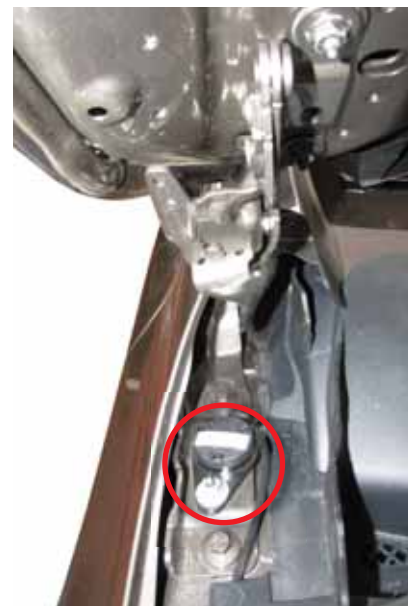
▶ Actuador de elevación de las bisagras

volantazo incontrolado cuando se conduce a alta velocidad.