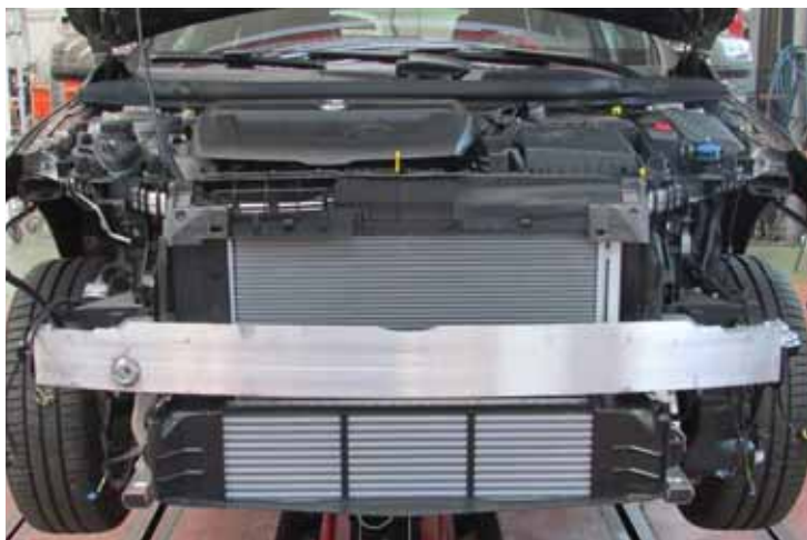
▶ Frente delantero, híbrido, y detalle de la travesía frontal

distancia respecto al vehículo que nos precede es preocupante, avisa al conductor mediante señales ópticas y acústicas y activa, al mismo tiempo, el servofreno de emergencia adaptativo para que, en cuanto el conductor pise el pedal del freno, éste actúe de forma rápida y precisa. La medición de esta distancia se efectúa mediante unos radares. Complementado a este sistema, opcionalmente puede incorporarse el Distronic Plus , que por sí sólo es capaz de frenar el vehículo hasta su detención y, previa confirmación por parte del conductor, volver a acelerar. Por primera vez en esta categoría, Mercedes ofrece de forma opcional el sistema Pre-safe , que cuando detecta un peligro activa, de modo preventivo, diversos sistemas de seguridad que incorpora el vehículo, contribuyendo a reducir el riesgo de lesiones a los ocupantes. El sistema toma información de forma sistemática de otros sensores, como los del ESP y BAS, que detectan situaciones críticas de conducción y envían al sistema Pre-safe la información necesaria para que actúe de forma preventiva (por ejemplo, anticipándose y fijando el cuerpo del conductor y del acompañante mediante un pretensado de los cinturones de seguridad e, incluso, cerrando las ventanillas y el techo corredizo si dispusiese de esa opción). La dirección paramétrica es del tipo servoasistida, con asistencia variable en función de la velocidad, lo que permite realizar maniobras sin esfuerzo a baja velocidad y evitar el peligro de un