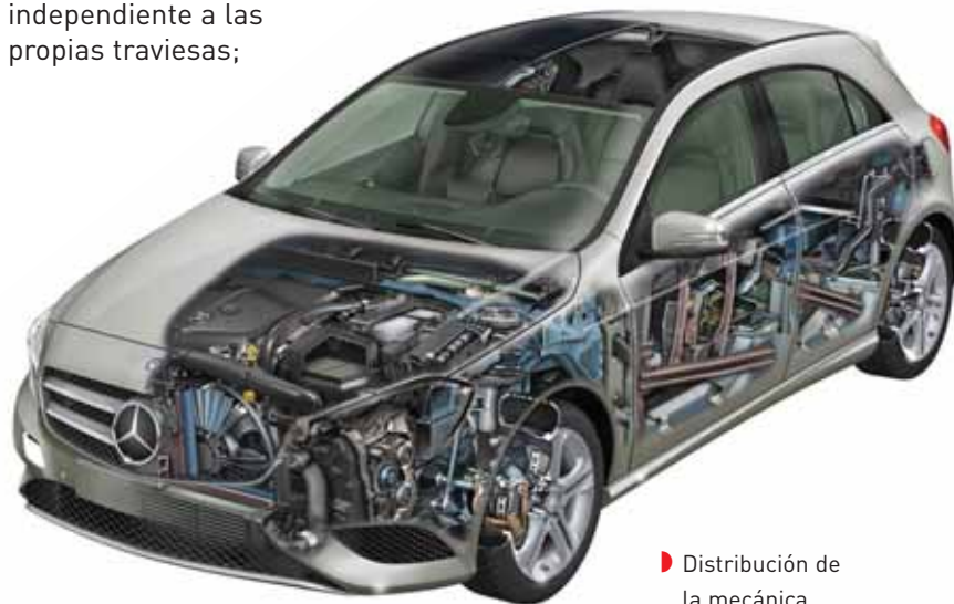
► Distribución de la mecánica

Los absorbedores de las travesías se comercializan de manera independiente a las propias travesías;