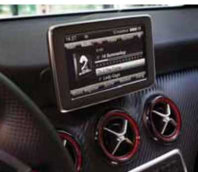
► Pantallas multimedia

Dispone de cuatro niveles de equipamiento: Urban , Style , línea AMG y Sport . Entre ellos hay diferencias