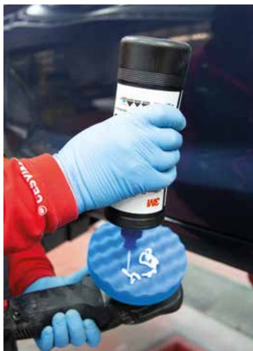
► Aplicación de producto abrillantador, con boina en forma de huevera