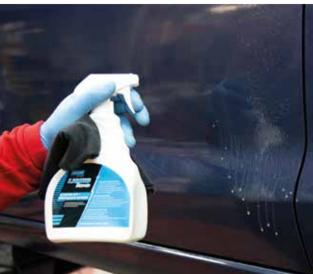
► Cera protectora

Todos estos procesos deben ir acompañados del respectivo enmascarado de las piezas adyacentes, para evitar salpicaduras y proyecciones.