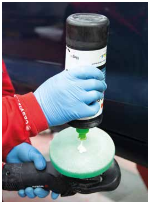
► Pulido-desbastado con pasta de corte rápido