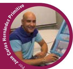
Por Juan Carlos Hernández Primitivo

COMO UN ESPEJO: ASÍ ES COMO UN GRAN PORCENTAJE DE PROPIETARIOS QUIEREN QUE SE LES ENTREGUE EL VEHÍCULO TRAS UNA REPARACIÓN. BIEN COMO DEFERENCIA HACIA EL CLIENTE O BIEN POR ELIMINACIÓN DE ALGÚN DEFECTO , EL PULIDO FINAL DE UN VEHÍCULO O DE ALGUNA DE SUS PIEZAS ES UNA OPERACIÓN MÁS DEL TALLER. ANALIZAMOS, A CONTINUACIÓN, ESTE PROCESO, TANTO EN LO REFERENTE A PRODUCTOS COMO A LOS PASOS A SEGUIR EN EL PULIDO DE UNA PIEZA