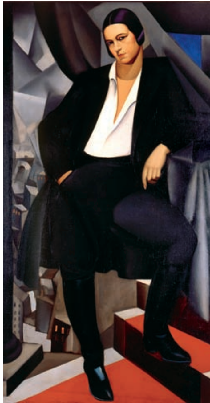
Tamara de Lempicka, Retrato de la duquesa de La Salle , 1925.