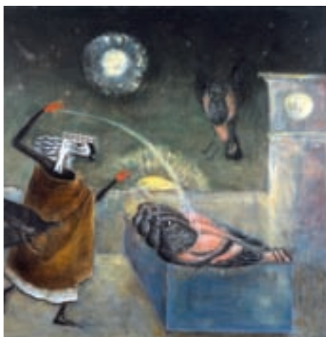
Leonora Carrington, Asurbanipal , 1958.

A Carrington le encantan las historias de la mitología celta que su madre y su niñera le contaron cuando era pequeña.