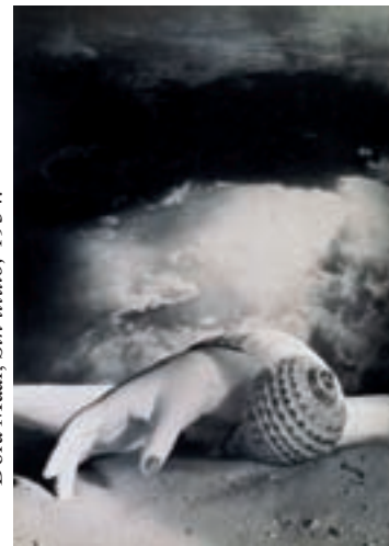
Dora Maar, Sin título , 1934.

(1907-1997) Aunque fue una gran artista, es sobre todo conocida por su relación con Pablo Picasso . Sus fotos están llenas de misterio.