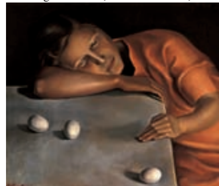
Ángeles Santos, Niña durmiendo , 1929.

Sus pinturas, pobladas de personajes ensimismados en sus pensamientos, tienen un aire muy enigmático. Utiliza muchos tonos de grises y su manera de pintar y la luz de sus cuadros hacen que las formas tengan un aspecto metálico.