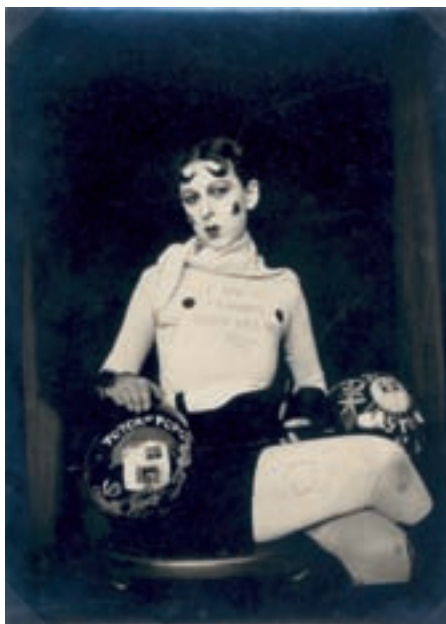
Claude Cahun, I'm in training, don't kiss me , 1927.

(1894-1954) Utilizaba su cuerpo como protagonista de sus fotografías. Se vestía de hombre, de gimnasta, de Buda, de ser andrógino.