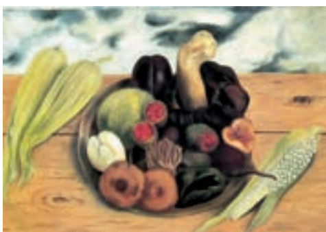
Frida Kahlo, Frutos de la tierra , ca.1939.

Su vida y su arte estuvieron marcados por un trágico accidente. A los 17 años, un tranvía chocó contra el autobús en el que viajaba y Frida sufrió heridas que la obligaron a pasar por numerosas operaciones. Durante meses tuvo que estar en cama recuperándose, y es entonces cuando empezó a pintar. Enseñó sus obras a Diego Rivera , un famoso pintor mexicano, con el que luego se casó. Sus cuadros mezclan la realidad con la fantasía y en ellos habla de su vida y de su país.