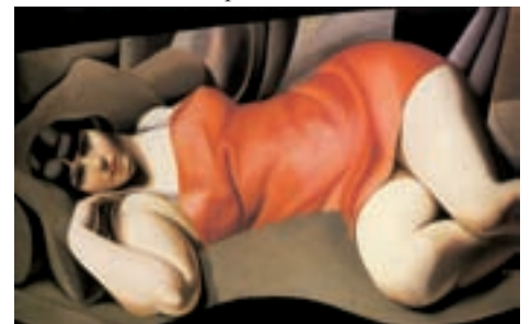
Tamara de Lempicka, La túnica rosa , 1927.

Lempicka retrató a mujeres glamurosas y elegantes, que vestían de forma atrevida, llevaban el pelo a lo garçon e iban a fiestas. Son mujeres modernas.