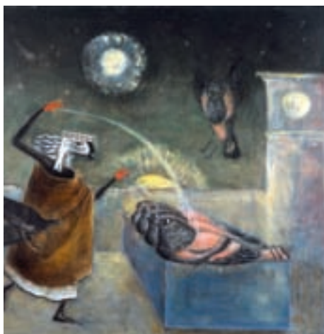
Leonora Carrington, Asurbanipal , 1958.

A Carrington le encantan las historias de la mitología celta que su madre y su niñera le contaron cuando era pequeña.