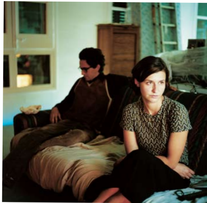
Sin título ( Ari y Gino ), 2000 Colecciones FUNDACIÓN MAPFRE

Para iluminar a Ari ha utilizado pantallas de ordenador o televisores. Consigue así una luz tenue que deja parte de la escena en penumbra, como si fuera un cuadro tenebrista, con luces y sombras.