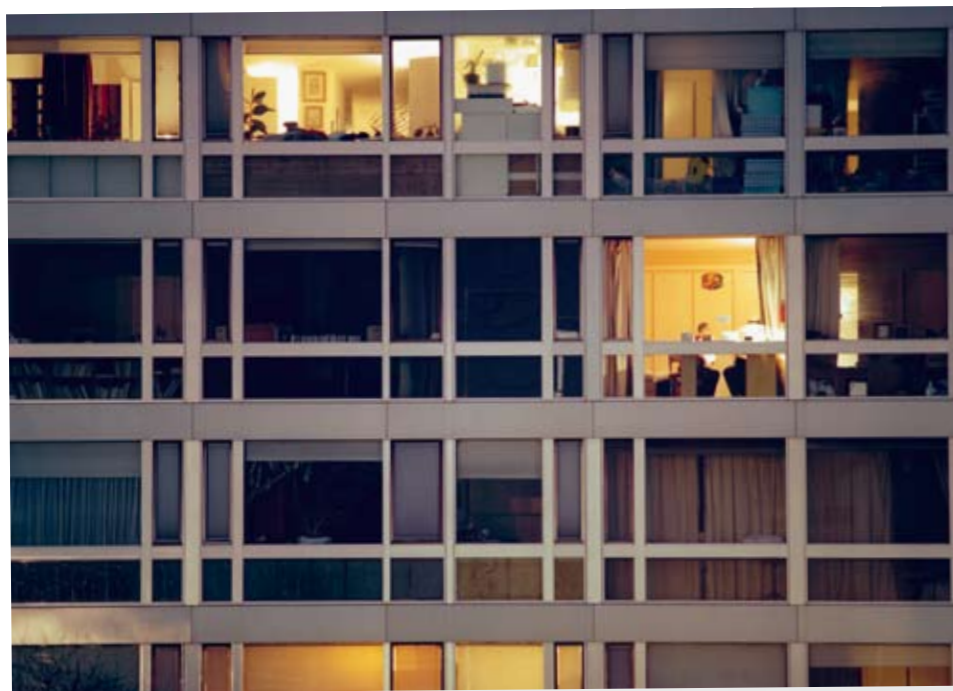
Sin título ( Fachada III ), 2002. © Anna Malagrída