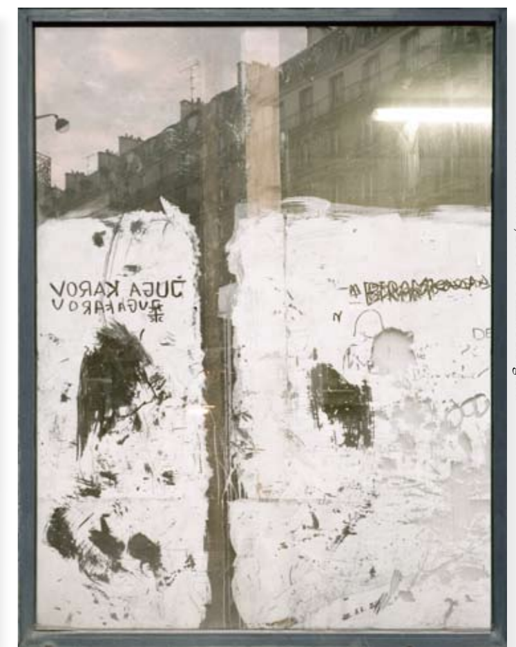
Rue Ribouré, 2008. © Anna Malagrída