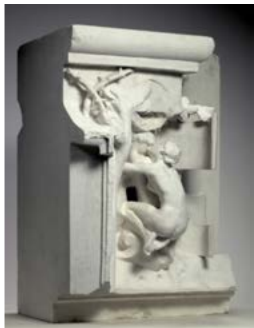
Las Metamorfosis de Ovidio,