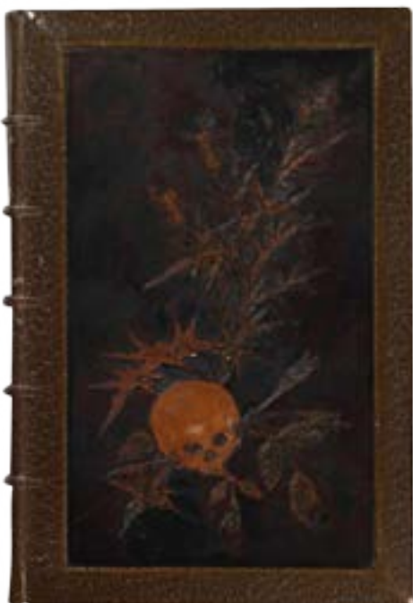
Ejemplar de la edición original de Las flores del mal , adornado con dibujos por Rodin, 1887-1888