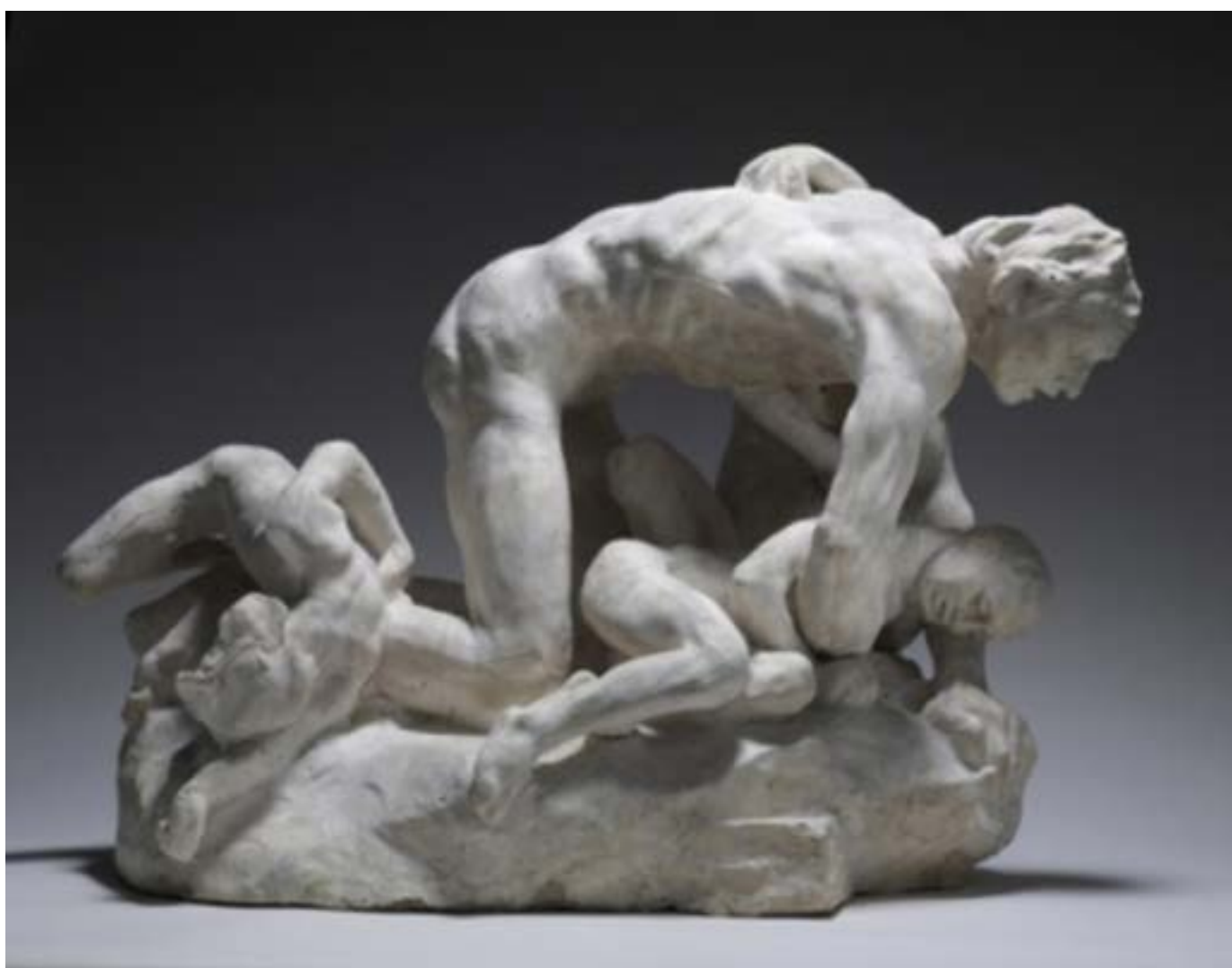
Ugolino y sus hijos, 1881-1882

Guiado por el poeta latino Virgilio, quiere encontrarse en el Paraíso con su amada Beatriz. Rodin se da a la tarea con frenesí, tratando de plasmar sus ideas con el dibujo y el modelado . Medita la composición global de su obra y al principio imagina una puerta formada por cuarterones yuxtapuestos con paneles esculpidos en bajorrelieve, como muestran las dos primeras maquetas modeladas y varios grandes dibujos de conjunto.