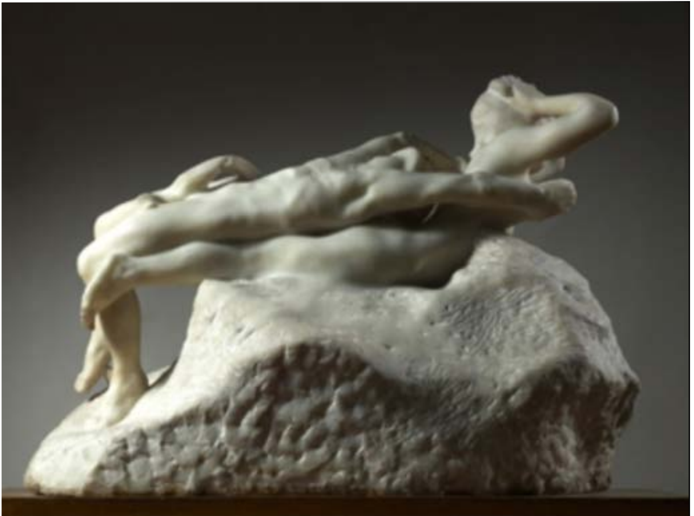
Fugit Amor , antes de 1887

Durante el periodo de intensa actividad creativa iniciado en 1880, Rodin creó un amplio repertorio de varios cientos de formas . El escultor no las incluyó todas en La puerta del Infierno , o no lo hizo inmediatamente, pero desde entonces y hasta el fin de su actividad reutilizó figuras, grupos y fragmentos para sus creaciones posteriores. Los primeros ejemplos fueron simplemente aislados y realzados colocándolos sobre una base (pedestal, roca, zócalo...) para poder exponerlos, en yeso o traducidos en otro material como el bronce o el mármol. A otros se les ensambló algún elemento (cabeza, brazo, pierna, figura entera, etc.) para crear una obra nueva ; y otros, desde finales de la década de 1890, se aumentaron o redujeron , enteros o fragmentados, modificando así profundamente su presencia ante el espectador, hasta el punto de que en estos casos se deben considerar como versiones completamente nuevas de obras antiguas.