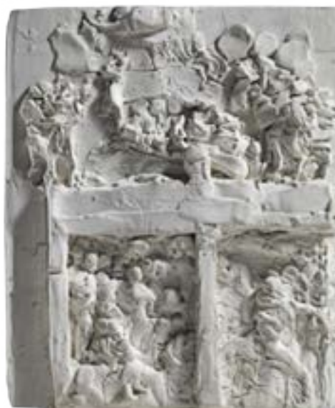
Segunda maqueta de La puerta del Infierno , 1880