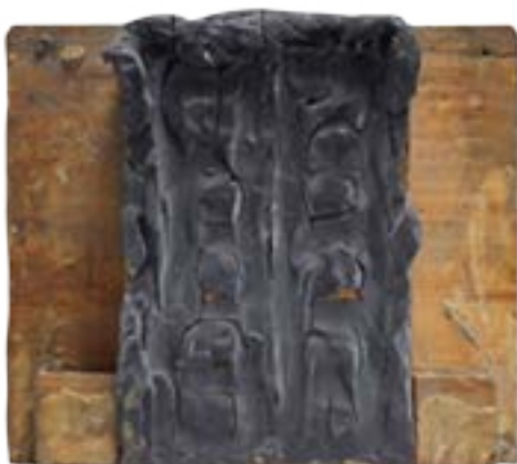
Primera maqueta de La puerta del Infierno , 1880