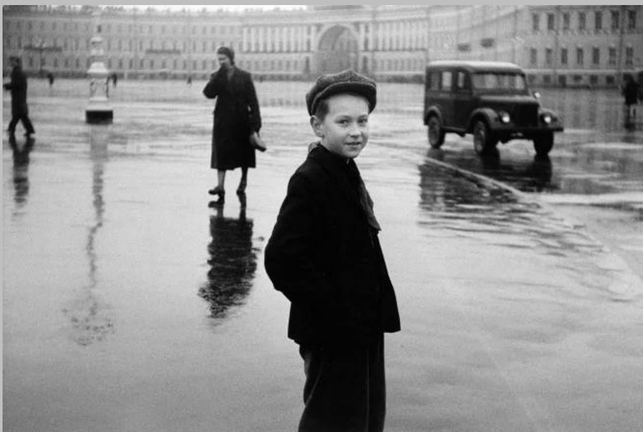
Boy in Leningrad, 1958 Copia en gelatina de plata Duane Michals. Cortesía de DC Moore Gallery, Nueva York © Duane Michals