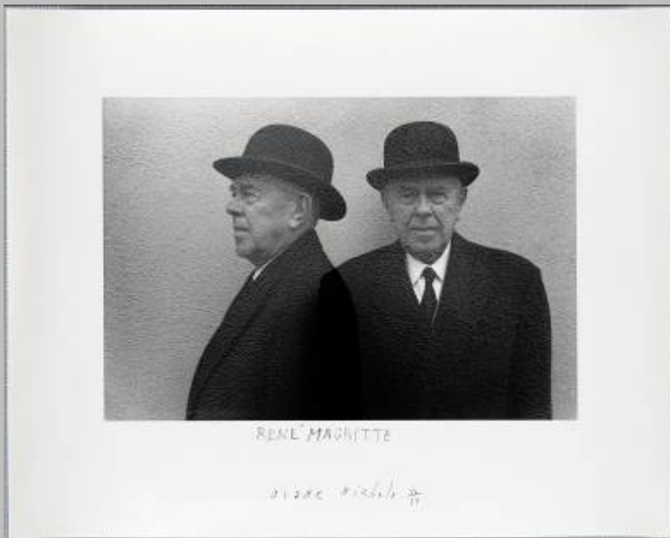
René Magritte (Profile and Full Face), 1965 Copia en gelatina de plata con texto manuscrito Carnegie Museum of Art, Pittsburgh The Henry L. Hillman Fund, 2009.31.2

muchas de sus exigencias e invenciones formales.