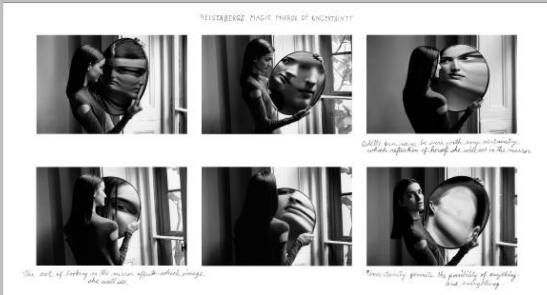
Dr. Heisenberg's Magic Mirror of Uncertainty, 1998 Secuencia de 6 copias en gelatina de plata con texto manuscrito Duane Michals. Cortesía de DC Moore Gallery, Nueva York ©Duane Michals

La selección presentada en esta exposición incluye sus secuencias más livianas, en las que juega con las convenciones ópticas como en Alice's Mirror [El espejo de Alicia] o en Dr. Heisenberg's Magic Mirror of Uncertainty [El espejo mágico de la incertidumbre del Dr. Heisenberg], pero también aquellas más reflexivas y oscuras, como The Return of the Prodigal Son [El retorno del hijo pródigo] o The Bogeyman [El hombre del saco]