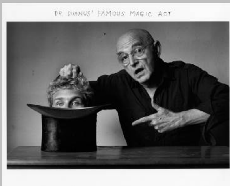
Dr. Duanus' Famous Magic Act, 1996

“When you look at my photographs, you are looking at my thoughts” [“Cuando observas mis fotografías, estás observando mis pensamientos”]. En esta frase radica la clave de lectura de la obra completa de Duane Michals: una obra que encaja, lo que sucede raramente, con su filosofía de vida. Hace sesenta años, al principio de su carrera, esta frase cimentaba ya unas imágenes destinadas a transformar los axiomas de la fotografía, revolucionando su forma y contenido.