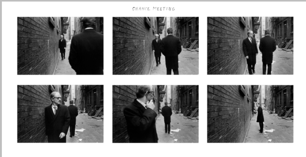
Chance Meeting, 1970 Secuencia de 6 copias en gelatina de plata Museo Nacional Centro de Arte Reina Sofía, Madrid

En efecto, el trabajo de Michals se desarrolla desde un principio en territorios inexplorados, mal digeridos por el establishment de la fotografía. El propio artista afirma que tuvo la suerte de no haber estudiado nunca fotografía y, por consiguiente, de no conocer sus reglas. Ello le ha permitido alejarse de las prácticas habituales sin preocuparse en absoluto por los límites que se autoimpone la fotografía.