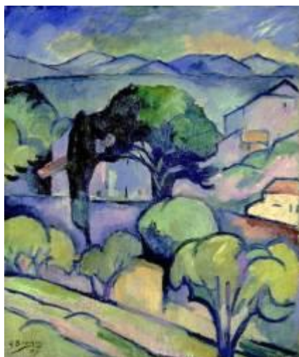
Georges Braque , Paysage de Provence, l'Estaque , 1907 Colección particular, Alemania

Finalmente, la exposición cerrará con un grupo de pinturas que presentan los distintos caminos que tomaron los fauves a partir de 1907. Aunque desde el comienzo el fauvismo estuvo fundamentalmente centrado en el paisaje, muchos de ellos se vieron muy atraídos por la vida del París nocturno, tema por otro lado típico de la vanguardia. Vlaminck, Rouault y Van Dongen reflejan este mundo de prostitutas y personajes de circo con una gran crudeza y vivacidad a través de colores exaltados y pinceladas enormemente expresivas y violentas, que enlazan en cierto modo con la pintura expresionista que estaba naciendo fuera de Francia.