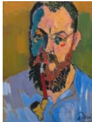
André Derain, Henri Matisse, 1905 Tate, Londres