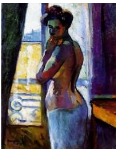
Henri Manguin , Devant la fenêtre , 1904 Colección particular

Pese a la importancia que ha tenido en la Historia del Arte moderno, el fauvismo ha sido un movimiento que ha pasado casi desapercibido en España, siendo esta la primera gran exposición que lo aborda en su conjunto y en profundidad en los últimos quince años. La muestra traza un recorrido por el fauvismo desde sus inicios en el taller de Gustave Moreau hasta la desintegración del grupo a finales de 1907. Incluye obras de todos los artistas que formaron el grupo: Henri Matisse, André Derain, Maurice de Vlaminck, Albert Marquet, Henri Manguin, Charles Camoin, Jean Puy, Raoul Dufy, Othon Friesz, Georges Braque, Georges Rouault y Kees van Dongen, y hace hincapié en las relaciones artísticas y personales entre ellos.