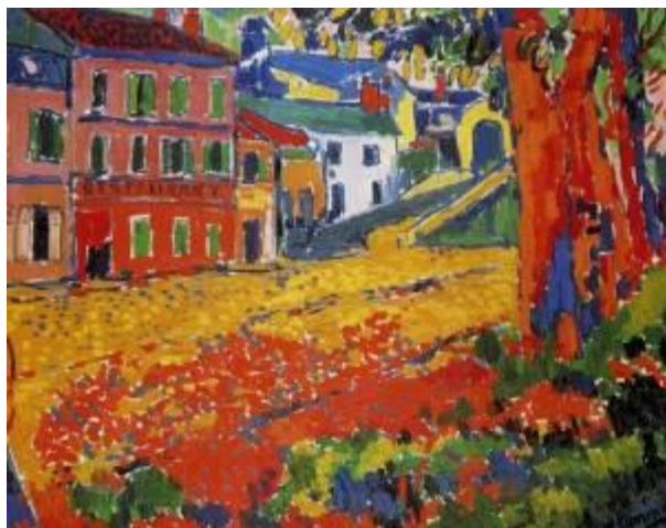
Maurice de Vlaminck , Restaurant de la Machine à Bougival , ca. 1905 Musée d'Orsay, donación de Max y Rosy Kaganovitch, 1973

Fundación MAPFRE presenta la exposición Los Fauves: La Pasión por el Color que se podrá visitar del 22 de octubre 2016 al 29 de enero de 2017 en la sala de exposiciones de Fundación MAPFRE en el Paseo de Recoletos de Madrid. La muestra, que hace una completa y cuidada presentación del fauvismo, reúne más de un centenar de pinturas, así como numerosos dibujos, acuarelas y una selección de piezas de cerámica.