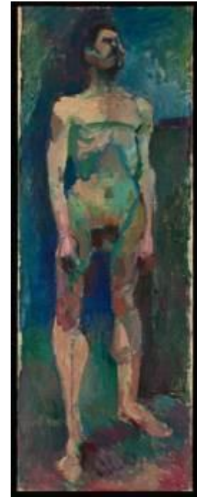
Henri Matisse, Académie d'homme, 1902 Musée Cantini, Marsella

La exposición comienza con una sección dedicada a los primeros intentos pictóricos llevados a cabo por los artistas que formarían el grupo fauve durante sus años de formación. Los primeros contactos entre ellos se remontan a la década de 1890, cuando Henri Matisse, Georges Rouault, Albert Marquet, Henri Manguin y Charles Camoin coincidieron en el estudio de Gustave Moreau en la École des Beaux-Arts de París. Moreau fue un maestro atípico dentro de la rigidez del mundo académico. Incitaba a sus alumnos a expresarse libremente a través del color y a buscar la autonomía pictórica. El grupo de alumnos de Moreau, liderado por Matisse y al que pronto se sumaron otros jóvenes artistas como Jean Puy, André Derain y Maurice de Vlaminck, comenzó muy pronto a experimentar con los colores puros y las pinceladas expresivas de la pintura moderna de Van Gogh, Gauguin y Cézanne que se exponía esos años en las galerías más atrevidas de París. Pintaban a menudo juntos, motivados por un fuerte espíritu de emulación, como se puede apreciar en los estudios de modelo desnudo que transmiten el ambiente del taller compartido. Estas academias, junto a las naturalezas muertas y a las escenas de interior que forman esta sección permiten apreciar el eclecticismo y la audacia de estos años de formación y descubrimientos.