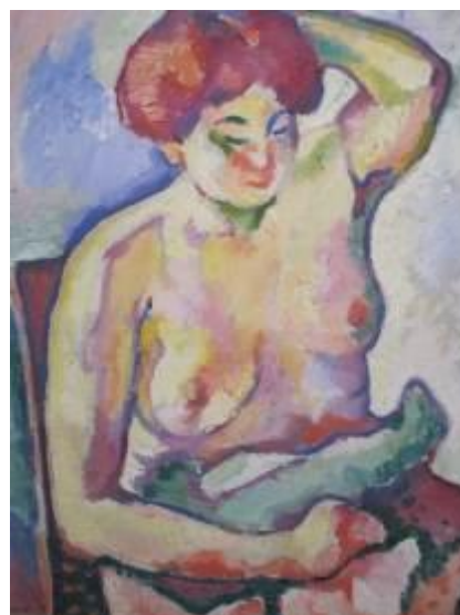
Georges Braque , Nu assis , 1907 Colección S&P Traboulsi

Formados en los talleres de Gustave Moreau y de Eugène Carrière, los fauves se agruparon en torno a Henri Matisse a finales de la década de 1890 y realizaron sus primeros ejercicios con colores puros durante los años siguientes. Octubre de 1905 fue una fecha decisiva para estos artistas porque sus obras fueron expuestas en la Sala VII del Salon d'Automne. El resultado causó un auténtico revuelo entre los asistentes y el crítico de arte Louis Vauxcelles no dudó en calificarlos en su reseña de "fieras" – fauves , en francés- debido a la fortísima intensidad de las tonalidades utilizadas, en contraste con dos bustos de mármol expuestos en la misma sala. En efecto, las obras que hoy resultan alegres y decorativas, en 1905 y a un público que estaba aún asimilando los avances de la pintura impresionista, parecieron salvajes y violentas. Aun comparadas con los postimpresionistas, el arte de los fauves posee una pureza y una inmediatez que todavía sigue sorprendiendo, debido al resultado profuso e imprevisible y a la ausencia de las tradicionales reglas con las que se practicaba la pintura.