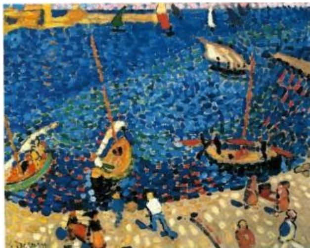
André Derain, Bateaux à Collioure , 1905 Kunstsammlung Nordrhein-Westfalen, Düsseldorf

A partir de 1904 los fauves comenzaron a pasar temporadas cada vez más largas en la Costa Azul. La atmósfera mediterránea constituyó para estos artistas una revelación y, gracias a ella, estudiaron la incidencia de la luz en el color y aumentaron intensamente el tono de sus paletas. En el verano de 1905, periodo decisivo para el fauvismo, Matisse y Derain se instalaron en el pueblecito pesquero de Collioure. Allí vivieron un período de cooperación artística asombrosamente productivo gracias al cual crearon las obras que causaron sensación en el Salon d'Automne de 1905. Matisse, que a su llegada a Collioure estaba muy influido por el neoimpresionista de Signac, encontró en el ímpetu juvenil de Derain un estímulo para trabajar con una mayor libertad pictórica. Por su parte, Derain ganó confianza en su pintura gracias al apoyo de Matisse, que era diez años mayor que él y ya gozaba de una cierta reputación. A lo largo del verano, los dos artistas fueron liberándose de la rigidez de la técnica puntillista de obras como Figure à l'ombrelle de Matisse o Bateaux à Collioure de Derain, creando una técnica variada, audaz y espontánea, que se aprecia en obras como Le Faubourg de Collioure .