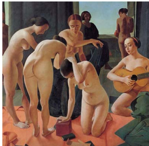
Felice Casorati Concerto [Concierto], 1924 Temple sobre tablero de contrachapado, RAI. Direzione Generale, Turín.

El tema del desnudo tiene una amplia difusión. No sólo en la pintura italiana, también en la europea e, incluso, la norteamericana de los años veinte y treinta, que participa de esa mirada renovada por el ser humano que caracteriza la poética de la “vuelta al orden” – pensemos en Hopper-. “Volver a situar al hombre en el centro del mundo, volver a hacer del cuerpo humano la medida del mundo, tal es el primer deber del arte moderno si se quiere recuperar sus leyes, ritmos y razones” señalaba Ugo Ojetti en la presentación de la exposición Venti artisti italiani en 1924.