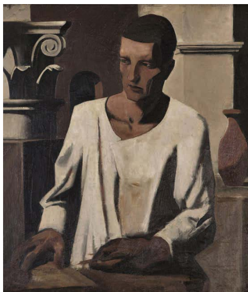
Mario Sironi L'architetto [El arquitecto], 1922-1923 Óleo sobre lienzo Colección particular