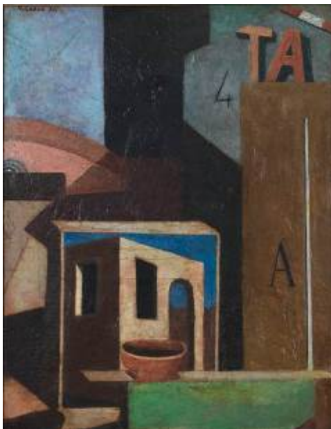
Carlo Carrà Composizione TA (Natura morta metafisica) [Composición TA (Bodegón metafísico)], 1916-1918 Mart, Museo di Arte Moderna e Contemporanea di Trento e Rovereto. Colección VAF-Stiftung.

que se dirige el arte italiano. Entre 1918 y 1919, Giorgio de Chirico pinta su Mélancolie hermétique [Melancolía hermética], 1918-1919, que se relaciona con algunos de los bodegones de Morandi, en los que el boloñés introduce también la idea del cuadro dentro del cuadro.