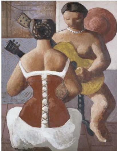
Massimo Campigli Donne con la chitarra [Mujeres con guitarras], 1927, Óleo sobre lienzo Pinacoteca di Brera, Milán.