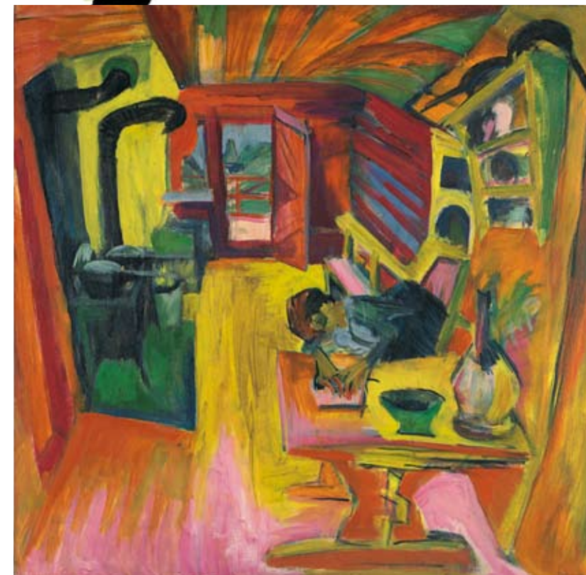
Cocina alpina, 1918. Óleo sobre lienzo. Museo Thyssen-Bornemisza, Madrid