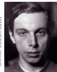
Autorretrato, c. 1919 Kirchner Museum Davos

ERNST LUDWIG KIRCHNER fue uno de los artistas más importantes del siglo XX. Nació en 1880 en la pequeña ciudad alemana de Aschaffenburg, cerca de Fráncfort.