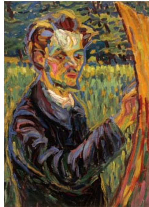
Retrato del pintor Heckel, c. 1907. Óleo sobre cartón. Colección particular

El nombre del grupo está tomado del filósofo Friedrich Nietzsche , quien en su libro Así habló Zaratustra utilizó el término "puente" como metáfora de la fugacidad humana "...encarna el sentido del pasar, del transcurrir de un estado a otro..."