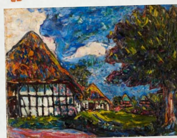
Casas de Föhnarn, 1908. Óleo sobre lienzo Städel Museum, Fráncfort del Meno

Visitó el museo de etnografía de Dresde, donde descubrió el arte de África y de Oceanía, en los que se inspiró para realizar esculturas de madera de gran expresividad.