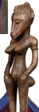
Talla Senufo. Costa de marfil.

Kirchner pintó esta obra en Berlín. En la pincelada enérgica y las formas puntiagudas se advierte el ajetreo que vivía el artista en estos momentos. Fíjate en el movimiento en la obra marcado por la rítmica repetición de los dedos de las manos de la primera mujer.