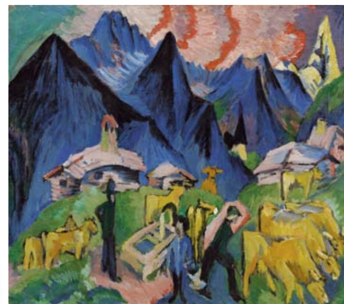
Vida alpina (tríptico), 1917-1919. Óleo sobre lienzo Kirchner Museum Davos, Berna, 2006

En 1914 se declaró la Primera Guerra Mundial y Kirchner tuvo que alistarse en el Ejército. En el frente sufrió una grave crisis nerviosa, por lo que fue licenciado e internado en un sanatorio.