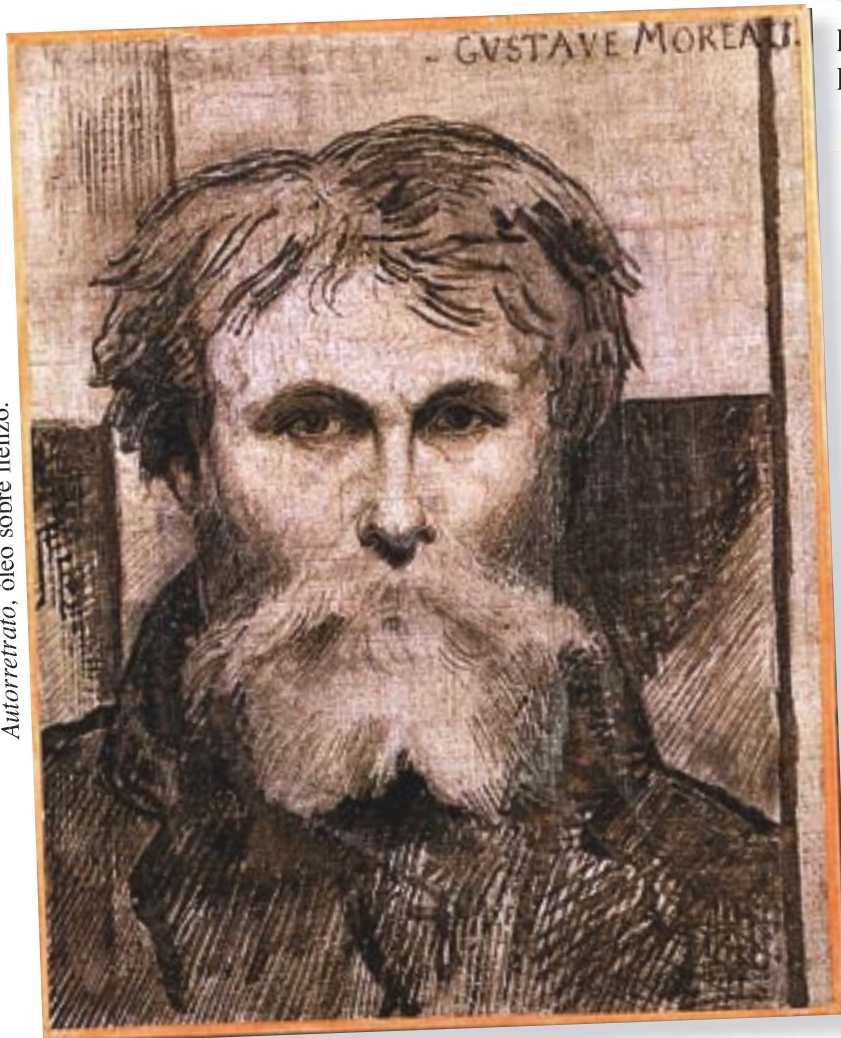
Autorretrato, óleo sobre lienzo.

Moreau tenía 65 años cuando hizo este autorretrato. ¿Te parece que refleja el aspecto de un hombre loco o se acerca más a la descripción que hacen sus alumnos?