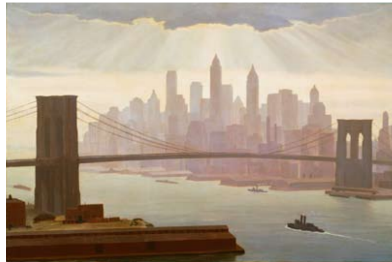
Edward Bruce. Poder , hacia 1933.

En la primera mitad del siglo XX los artistas americanos se fijan en el arte europeo para, a partir de él, crear un lenguaje propio. Nueva York se convierte en la capital del arte mundial. La Colección Phillips, a través de su obra, permite conocer la principales tendencias del arte americano del siglo XX.