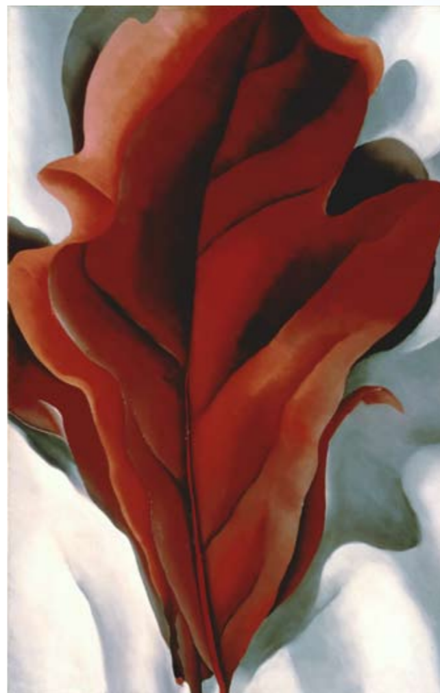
Georgia O'Keeffe. Hojas rojas oscuras grandes sobre blanco , 1925 © Georgia O'Keeffe Museum /VEGAP/ Madrid, 2010

Acércate con lupa a este cuadro y descubre los detalles en www.enredarte.com