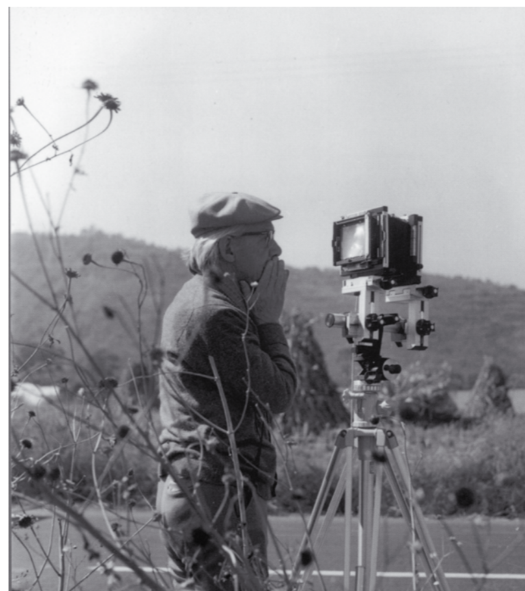
Graciela Iturbide, Manuel Álvarez Bravo ©Graciela Iturbide

Manuel Álvarez Bravo está considerado como uno de los artistas mexicanos más influyentes y uno de los padres de la fotografía moderna. ¡Vivió cien años!, desde 1902 a 2002, todo el transcurso del siglo XX, en el que la fotografía se consagró como una de las formas de expresión artística más importantes.