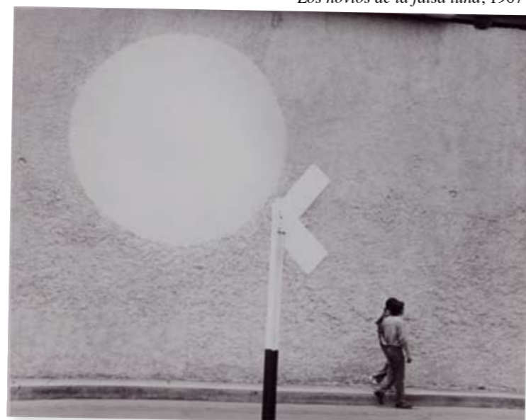
Los novios de la falsa luna, 1967

Manuel Álvarez Bravo era un “cazador” de imágenes. Salía a la calle, colocaba su cámara y trípode en algún lugar que pudiera ser interesante y esperaba lo necesario hasta lograr la imagen deseada. Y al final, los encuadres, los títulos ... dan un nuevo sentido a las imágenes cotidianas. En Los novios de la falsa luna , un elemento corriente (dos personas caminando por la calle) se transforma en pura poesía.