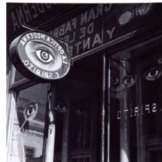
Parábola óptica, 1931

De 1943 a 1959 trabajó en el cine como fotógrafo. Colaboró en rodajes de películas de Luis Buñuel y John Ford . También realizó algunos documentales y cortometrajes.