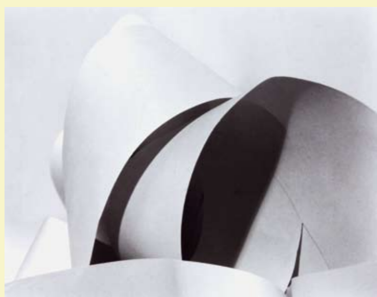
Ondas de papel, ca. 1928