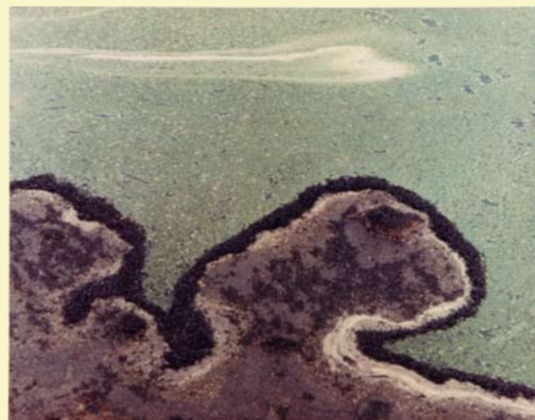
Corriente, Texcoco, 1974-1975

En este caso el fotógrafo situó la cámara completamente encima del paisaje, en un ángulo perpendicular respecto del suelo. De esta forma la imagen pierde referencias claras y se vuelve abstracta. El resultado es muy estético.