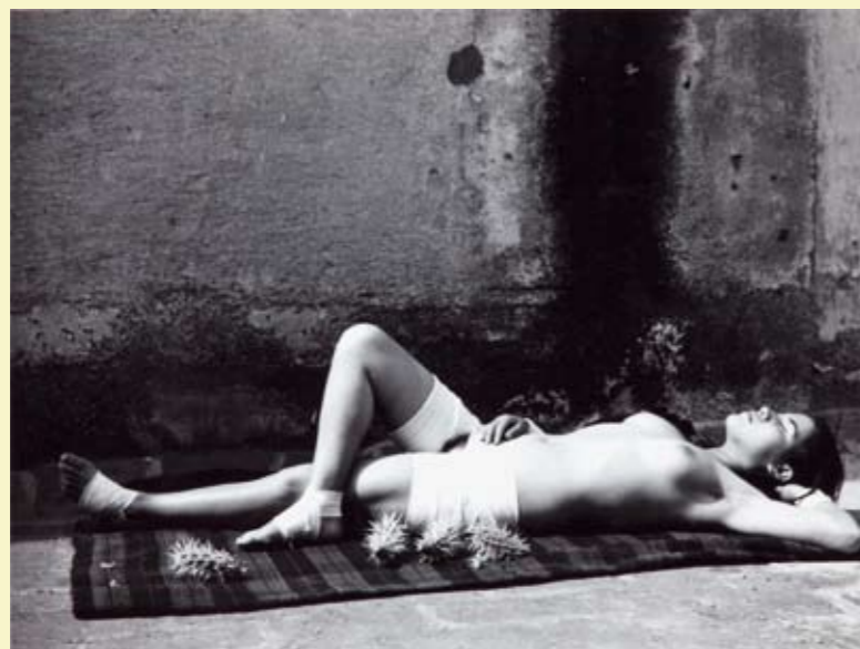
La buena fama durmiendo, 1938