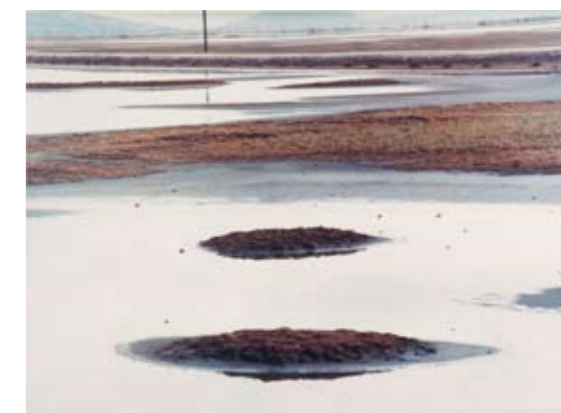
Como isla, 1963-1964

Las fotografías de Álvarez Bravo han sido un referente de modernidad por su utilización de recursos como el aislamiento de detalles, el orden geométrico y la relación entre imagen y palabra.