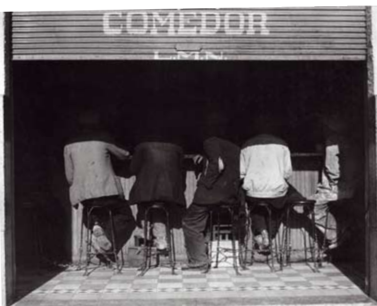
Los agachados, 1934

Los títulos de Manuel no son cabos sueltos: son flechas verbales, señales encendidas