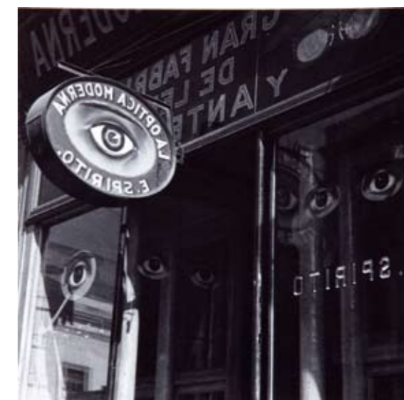
Parábola óptica, 1931

De 1943 a 1959 trabajó en el cine como fotógrafo. Colaboró en rodajes de películas de Luis Buñuel y John Ford . También realizó algunos documentales y cortometrajes.