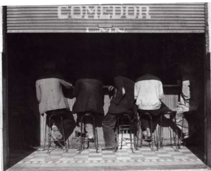
Los agachados, 1934

Los títulos de Manuel no son cabos sueltos: son flechas verbales, señales encendidas