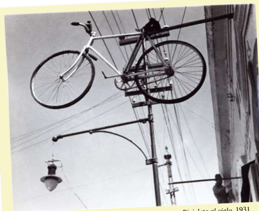
Bicicleta al cielo, 1931