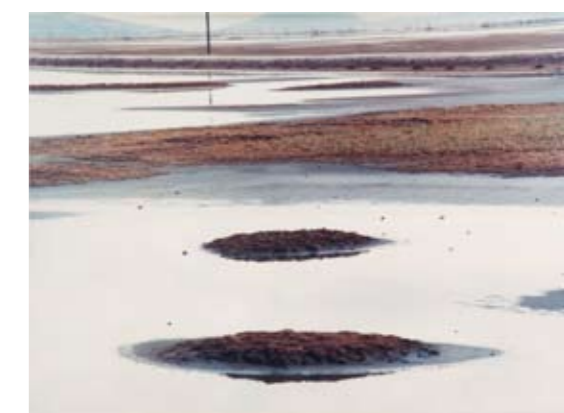
Como isla, 1963-1964

Las fotografías de Álvarez Bravo han sido un referente de modernidad por su utilización de recursos como el aislamiento de detalles, el orden geométrico y la relación entre imagen y palabra.