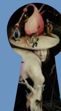
El Bosco. El jardín de las delicias. (detalle). Museo del Prado.