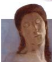
Odilon Redon. Mi retrato, 1867 Musée d'Orsay