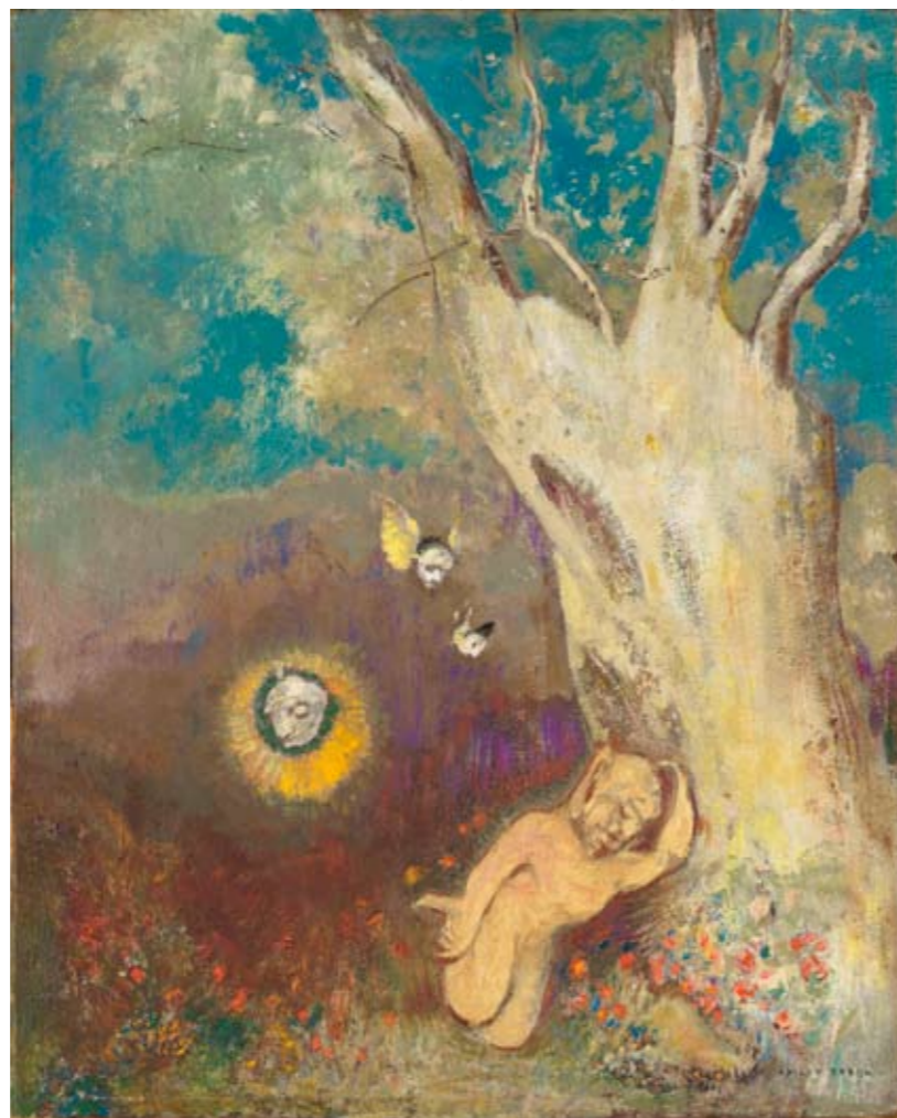
Odilon Redon. Sueño de Calibán , c. 1912 Musée d'Orsay

A los pies del árbol hay un personaje dormido. Es Calibán , uno de los protagonistas de La tempestad , una obra de teatro de William Shakespeare . A su alrededor está flotando la cabeza del espíritu del aire, Ariel, junto con otros espíritus. La escena evoca el ambiente de un cuento de hadas y el mundo de los sueños.