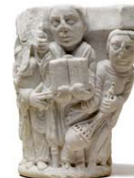
Capitel de San Nicolás, hacia 1200-1220

En la arquitectura románica todos los elementos se utilizan para contar historias. Las cornisas, los arcos, las fachadas y los capiteles sobre las columnas se decoran con relieves que se adaptan al espacio que ocupan.