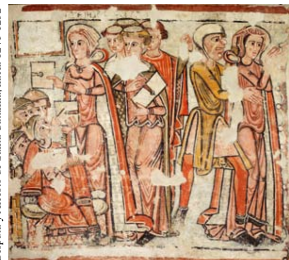
Disputa y Arresto de Santa Catalina, hacia 1241-1252

Catalina era una princesa muy sabia que había nacido en Alejandría, Egipto. Según la leyenda se encontró con 50 filósofos a los que convenció para que se convirtieran al cristianismo. Que una mujer fuera tan sabia enfureció mucho al emperador Maximiliano, que ordenó torturarla. La pobre princesa se convirtió en mártir y Santa.