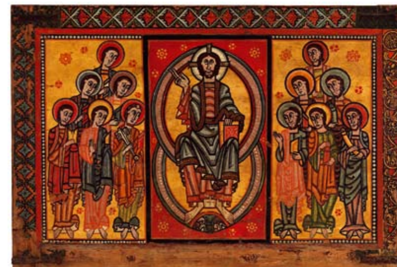
Frontal del Altar de la Seo de Urgel o de los Apóstoles, segundo cuarto del siglo XII

El altar es una mesa consagrada sobre la que el sacerdote celebra la misa. En el románico se decoraba con pinturas o relieves.