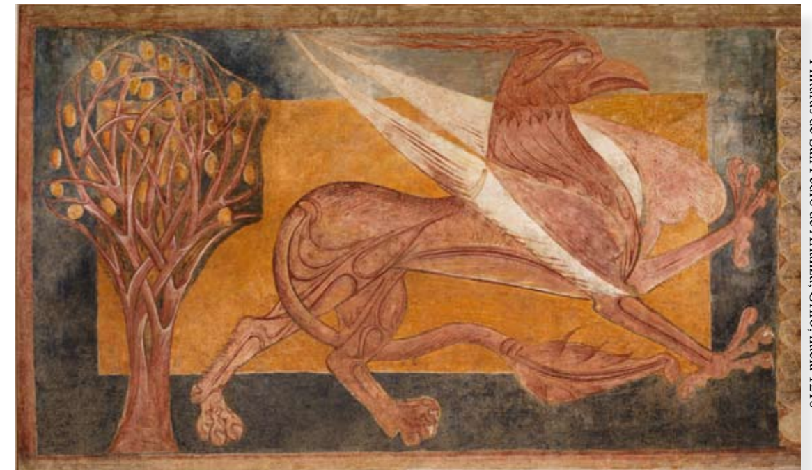
Pinturas de San Pedro de Arlanza. Grifo, hacia 1210

Se trata de una criatura mitológica, llamada grifo .