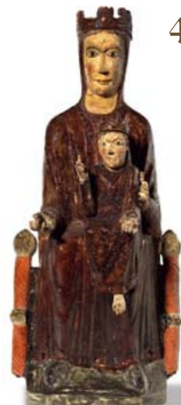
La Virgen de All, Hacia 1200

ENREDARTE Si quieres saber más sobre las iglesias románicas accede a www.enredarte.com