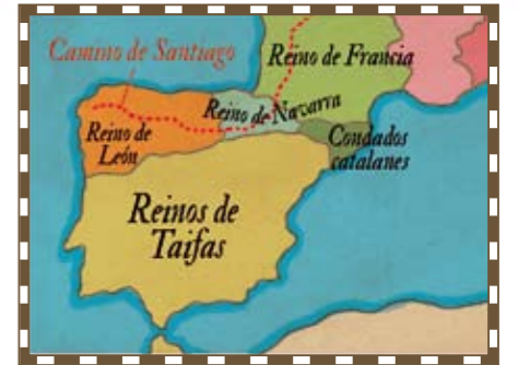
La Península Ibérica a principios del S. XI

Los caminos de peregrinación son las rutas que recorren los fieles para llegar a ciudades como Santiago de Compostela, donde se veneran las reliquias del apóstol Santiago el Mayor.