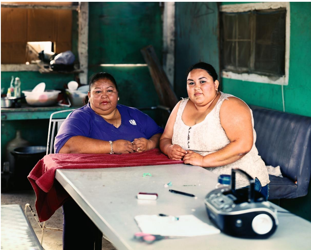
Between Borders #81, de la serie Between Borders, 2009-2010 Cortesía del artista