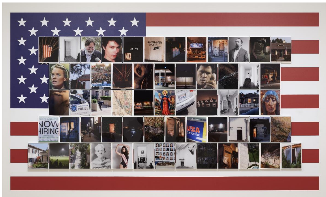
Serie Santa Barbara Return Jobs Back to US [Santa Bárbara: devuelve los empleos a EE. UU.], 2016

Dentro de esta línea de evolución en su trabajo, se encuentran los proyectos Photographic Structures GAN y We Sell Houses GAN (ambos de 2025), que utilizan un modelo de inteligencia artificial entrenado con el archivo del propio artista para generar obras de vídeo que incorporan la técnica de animación conocida como morphing .