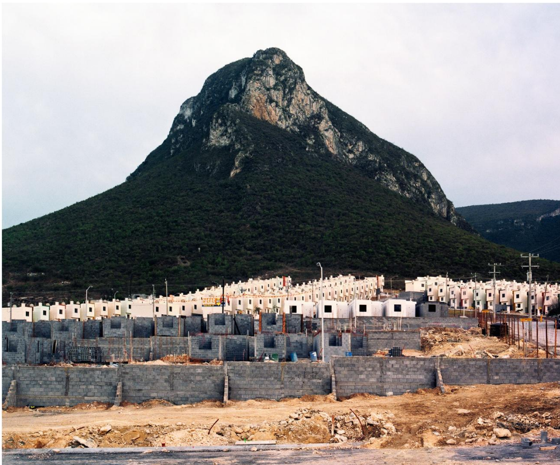
Fragmented Cities, Escobedo, de la serie Suburbia Mexicana, 2005-2010