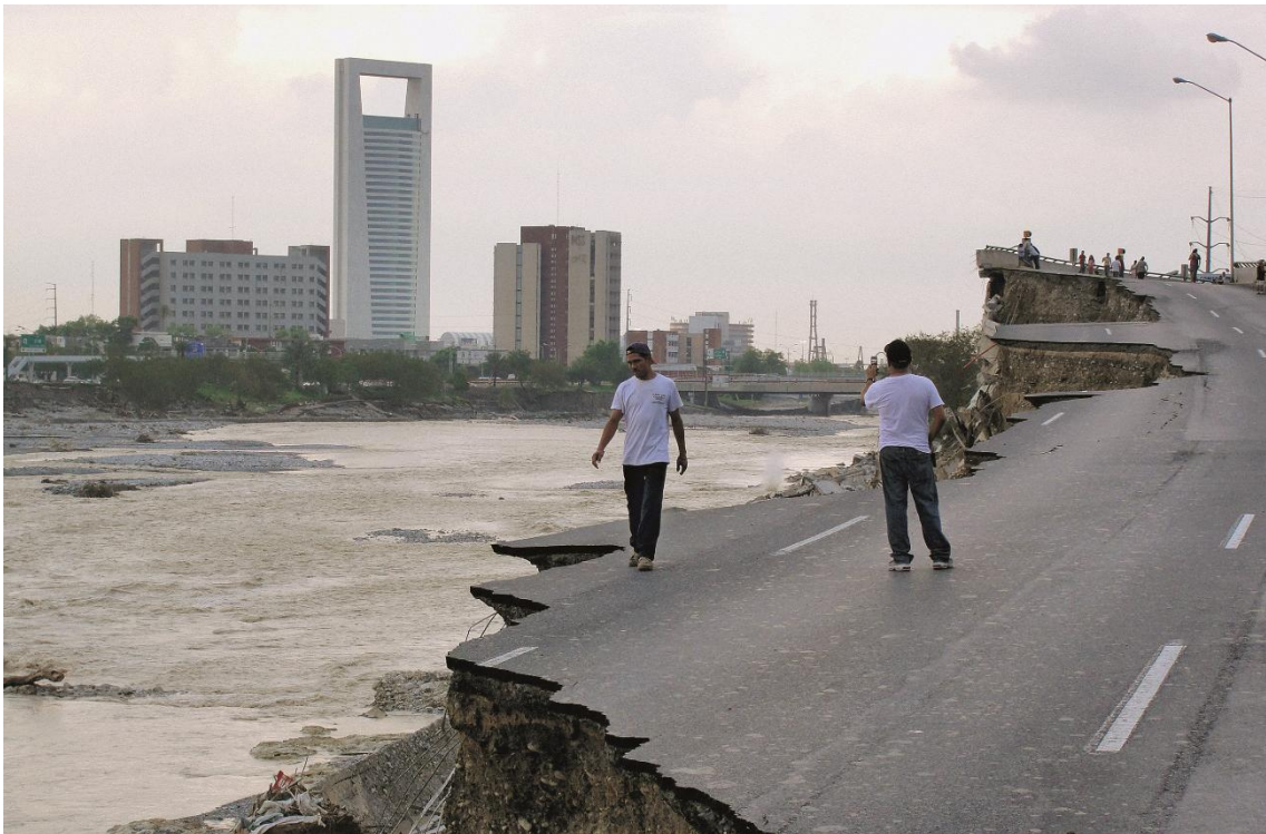
Rivers of Power #75 , de la serie Rivers of Power , 2010-2016