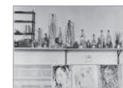
Detalle Algunos de los trabajos realizados por Pablo Picasso en su taller de pintura, situado en la calle de la Llotja de Barcelona.

Estancia de González en Barcelona por unos meses con la intención de encontrar trabajo en el entorno de Gaudí. En la ciudad coincide con Picasso, que lo retrata con la montaña del Tibidabo como fondo.