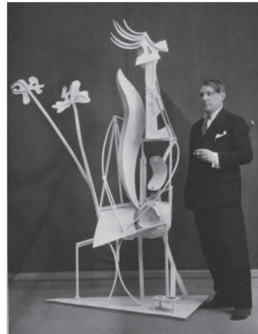
Pablo Picasso El pintor Pablo Picasso, nacido en Málaga el 25 de octubre de 1881, es uno de los artistas más importantes del siglo XX. Su obra se caracteriza por el uso de colores vivos y formas abstractas, creando una nueva forma de arte que influyó en numerosos movimientos de vanguardia. Su taller, situado en la calle de la Llotja de Barcelona, fue un espacio de experimentación y creación que atrajo a numerosos artistas y arquitectos de vanguardia.