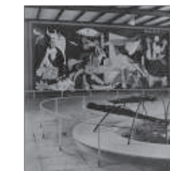
Detalle Algunos de los trabajos realizados por Julio González en su taller de metalistería artística, situado en la calle de la Llotja de Barcelona.

González comienza a redactar el manuscrito Picasso escultor y las catedrales , en el que se propone explicar en qué consiste la nueva escultura de Picasso. Este texto, sin embargo, se convierte en un manifiesto de su propia escultura, y en él emplea por primera vez el concepto de «dibujar en el espacio».