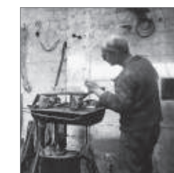
Detalle Algunos de los trabajos realizados por Julio González en su taller de metalistería artística, situado en la calle de la Llotja de Barcelona.

1924 Picasso recibe formalmente el encargo de realizar el monumento funerario en homenaje a Apollinaire.