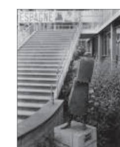
Detalle Algunos de los trabajos realizados por Pablo Picasso en su taller de pintura, situado en la calle de la Llotja de Barcelona.

1932 González termina la versión en bronce de Mujer en el jardín . Llega a su fin la colaboración entre ambos artistas.