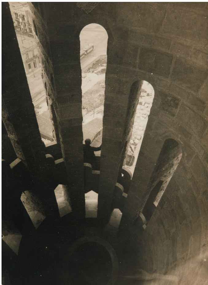
Adolf Mas, Interior de una torre de la Sagrada Familia , 1905

La exposición Adolf Mas. Los ojos de Barcelona , a través de 200 fotografías y diverso material documental, realiza un amplio recorrido por la obra de esta figura clave de la fotografía novecentista catalana dividido en cuatro secciones temáticas, que abordan los aspectos centrales de su trayectoria.