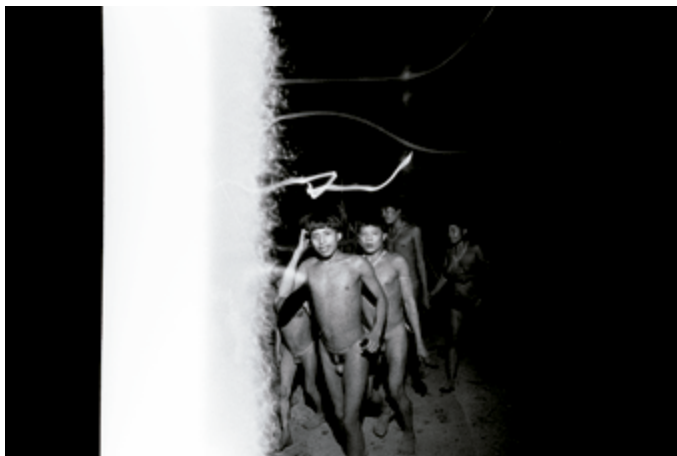
Naki uxima y Marokoi Wapokohipi thëri bailan y cantan en la choza comunitaria. Catrimani, Roraima, 1974

Desde 1993, después de que el año anterior, y gracias a la presión nacional e internacional, el Gobierno reconociera finalmente la demarcación del territorio yanomami, la artista fue retirándose gradualmente de la escena política, recurriendo solo al arte para mantener la visibilidad de la causa yanomami. En el año 2000 fue reconocida con el Premio a la Libertad Cultural de la Lannan Foundation, Los Ángeles. El festival PHotoEspaña contó en Madrid con su participación en las ediciones de 1999 y 2012. Hoy en día, sus obras se encuentran en algunas de las colecciones más importantes del mundo, entre ellas las del Museum of Modern Art de Nueva York o la Tate de Londres. Tras cuatro años de una profunda investigación en los archivos de la artista, Thyago Nogueira ha realizado una cuidada selección de fotografías, documentos, material audiovisual y dibujos realizados por los propios yanomami, selección que integra esta exposición, originalmente concebida por el Instituto Moreira Salles de Brasil y que, como parte de su itinerancia internacional, hoy podemos contemplar en las salas del KBr Fundación MAPFRE de Barcelona.