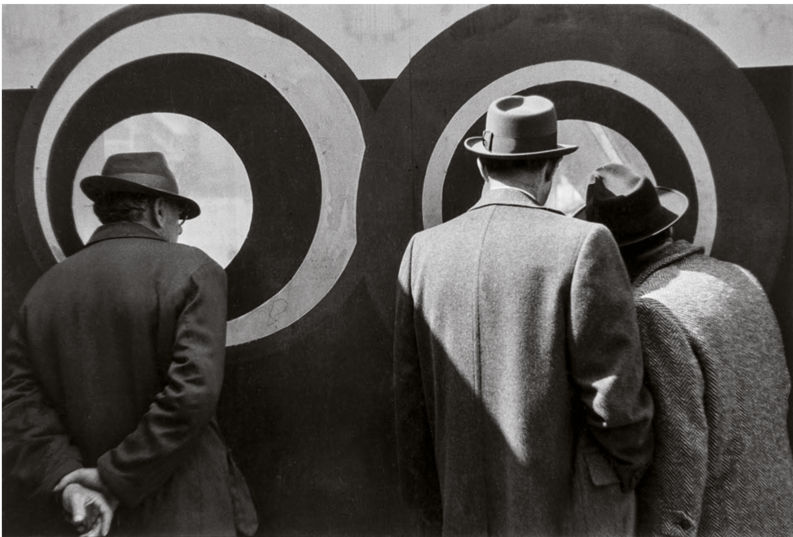
Concentric Circles, Construction Site, New York [Círculos concéntricos, obra, Nueva York], 1952 Imagen de plata en gelatina, 23 × 34,5 cm

Poeta con la cámara, la principal inspiración de Stettner procedía quizá del mundo literario, sobre todo de la obra de Walt Whitman. Hizo suya la fe del poeta estadounidense en sus semejantes y su confianza en el triunfo del espíritu humano, una convicción que le llevó siempre a las calles en busca de la humanidad esencial de la gente común. Prolífico escritor y crítico de fotografía, escribió por extenso y con franqueza sobre su propia visión artística, su ideario político de izquierdas y los fotógrafos de su círculo. Influido igualmente por la lectura de Karl Marx, Stettner mantuvo intacto su marxismo durante toda su vida, rindió homenaje a la clase trabajadora y produjo un gran corpus de fotografías de obreros en su lugar de trabajo. Como muestra la exposición, exploró una amplia gama de temas, y a menudo volvió sobre ellos a lo largo de su carrera. No obstante, su trabajo se mantiene temáticamente coherente: buscó la belleza en las personas comunes y en su vida cotidiana. Su profundo respeto y admiración por ellas unifica toda su obra, una oda visual a la humanidad que refleja su profunda empatía y generosidad de espíritu.