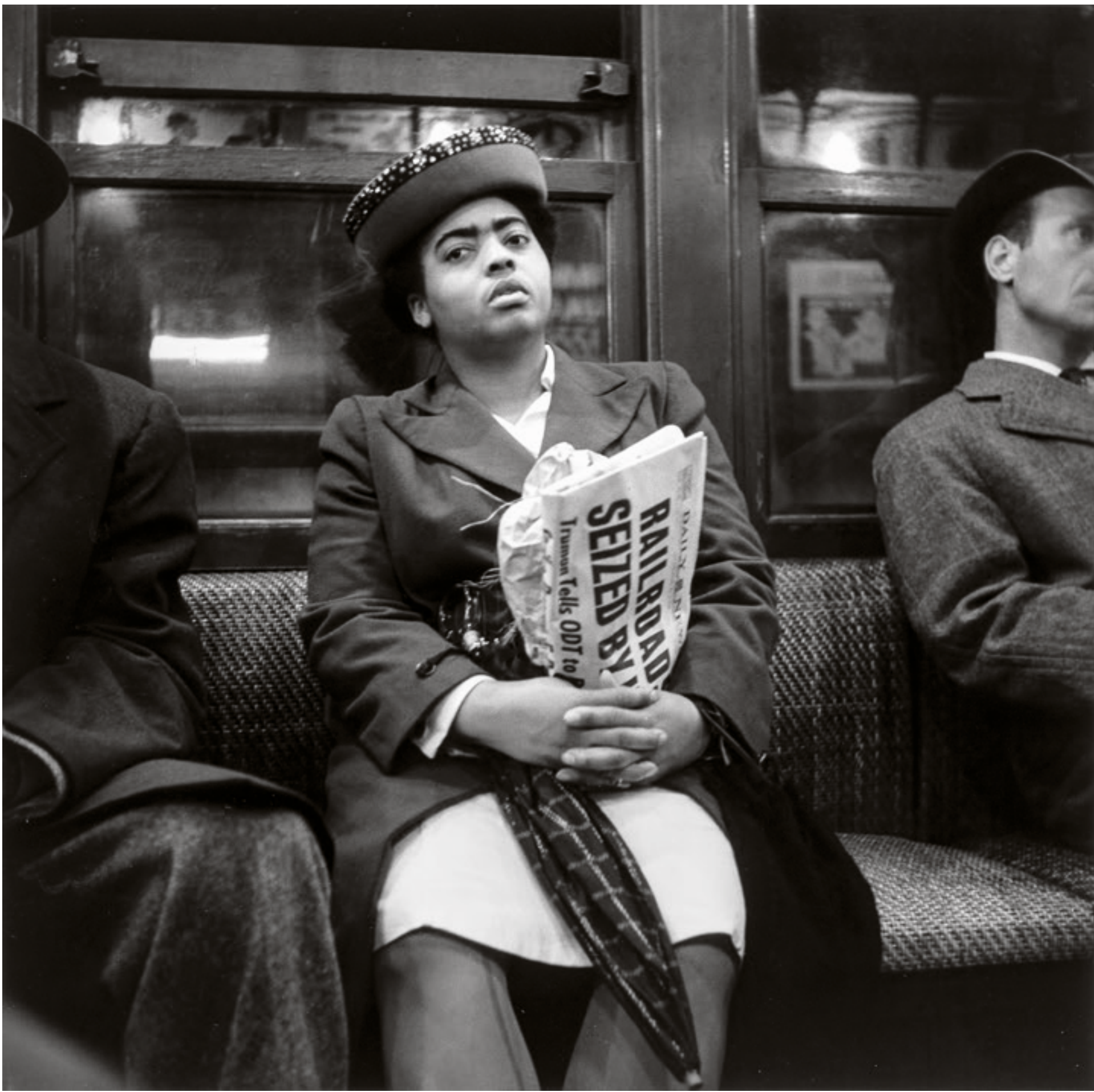
Woman Holding Newspaper, New York [Mujer sujetando un periódico, Nueva York], 1946 Imagen de plata en gelatina, 34,2 × 34,6 cm

Nacido en Brooklyn, Nueva York, en 1922, Louis Stettner creó miles de imágenes a lo largo de una carrera de casi ochenta años. Adquirió su primera cámara siendo un joven adolescente y pronto se sintió atraído por las calles de su ciudad natal. No tardó en hacerse un nombre en la famosa Photo League de Nueva York, donde entabló amistad con Sid Grossman y Weegee. Trabajó como fotógrafo de combate durante la Segunda Guerra Mundial, y la experiencia de luchar contra el fascismo hombro a hombro con sus compañeros soldados le llevó a desarrollar una creencia profunda y duradera en la humanidad esencial del hombre común. Terminada la guerra, Stettner visitó París en 1947 con la intención de pasar tres semanas en la ciudad, pero acabó quedándose cinco años y estudió cinematografía con una beca del Ejército. Durante este tiempo, forjó una relación duradera con Brassai, la ciudad y su gente. A lo largo de su carrera, Stettner se movió entre Nueva York y París, antes de instalarse definitivamente en la capital francesa en la década de 1990, donde permaneció hasta su muerte en 2016. Su trabajo desafía cualquier categorización y contiene elementos estéticos tanto de la fotografía de calle neoyorquina como de la fotografía humanista francesa. A caballo entre estas dos culturas, Stettner tendió un puente entre el enfoque de conciencia social estadounidense y la tradición lírica francesa para crear un acercamiento humanista singular hacia la fotografía.