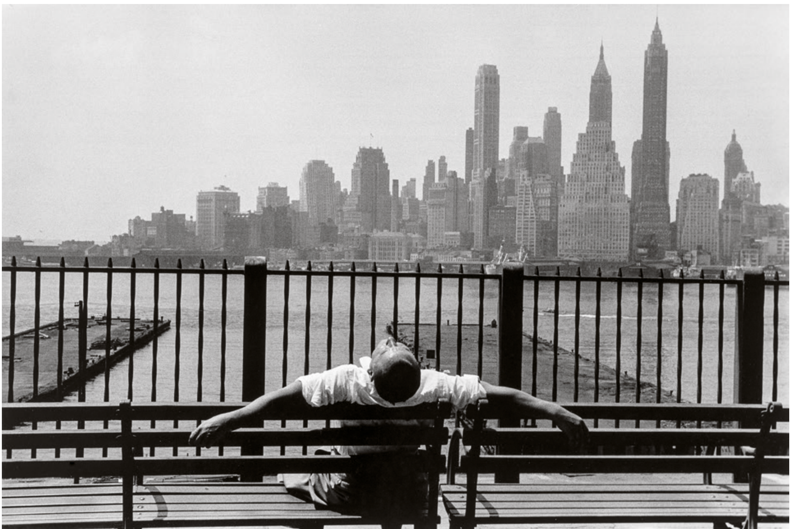
Brooklyn Promenade, Brooklyn, New York [Brooklyn Promenade, Brooklyn, Nueva York], 1954 Imagen de plata en gelatina, 29,8 × 44,8 cm

En las décadas de 1950 y 1960 existía cierta desconfianza hacia los fotógrafos que escribían, quizá porque parecía que estaban ubicados en un lugar a medio camino entre ambas disciplinas. Stettner se dedicó siempre a la escritura a la par que la fotografía, y escribió no solo sobre sí mismo, sino también sobre muchos de sus colegas y amigos artistas, tanto sobre los que le gustaban como los que no. Sus textos eran un poco como sus fotografías: abruptos, espontáneos e impetuosos. En la década de 1970, comenzó a publicar una columna mensual en la revista Camera 35 , dependiente de la Photo League, titulada primero «Speaking Out» [Hablando claro] y después «A Humanist View» [Una visión humanista]. Aunque escribió con profusión, no fue hasta 1979, ya de forma algo tardía, cuando publicó una de sus series en el libro Sur le tas , que recoge imágenes de hombres y mujeres trabajando.