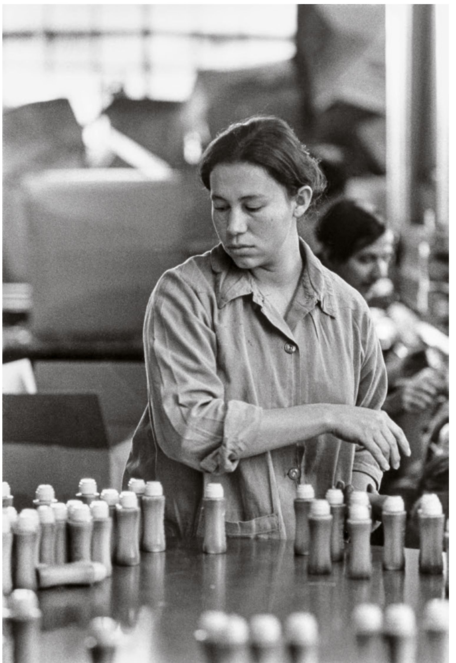
Assembly Line Worker, Long Island City, New York [Trabajadora en cadena de montaje, Long Island City, Nueva York], 1972-1974. Imagen de plata en gelatina, 31,2 × 21,1 cm

El compromiso social y su preocupación por los menos favorecidos, llevó a Stettner a fotografiar con frecuencia a trabajadores y obreros con el ánimo de presentarlos como individuos auténticos y dignos, al margen de lo precarias que fueran sus condiciones laborales. En sus propias palabras: «En medio del ruido, la suciedad, los humos y el riesgo de accidentes, me parecían personas muy sensibles, de una humanidad innata y con una maravillosa capacidad de organización y de percepción de la realidad inmediata. Siempre me hicieron sentir bienvenido y cómodo [...] mi estancia en las fábricas fue una de las experiencias más significativas de mi vida». Los trabajadores de Stettner parecen fuertes y orgullosos, a menudo están absortos en sus pensamientos y dominan la imagen en la que aparecen; trascienden su entorno laboral y se muestran como individuos autónomos que se niegan a dejarse abatir por el trabajo duro.