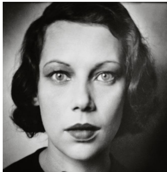
Tilly Losch, 1928