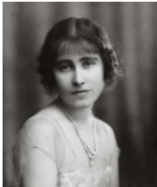
Elizabeth Bowes Lyon, duquesa de York, futura reina Isabel, Reina Madre, 1923

El resultado: unos primeros planos rigurosos, en los que se prescindía de todo aditamento, de fondos y decorados, y se incorporaba sólo aquello que aportase información: en ocasiones, la mirada; en otras, las manos, algo que le diferenciaba de sus contemporáneos. El propio Hoppé confiesa en su biografía: "Las expresiones faciales se pueden controlar, pero de las manos es frecuente olvidarse" ( A Hundred Thousand exposures , 1945).