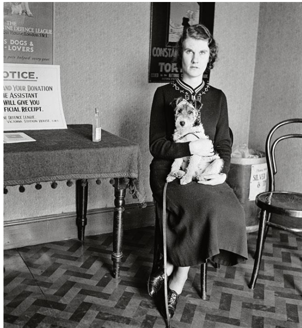
En la sala de espera del Hospital de Animales de Croydon, 1935

Hoppé utilizaba una Kodak Brownie escondida en una bolsa de papel -un recurso similar al que años después recurrirán en Walker Evans y Helen Levitt en sus excursiones por el metro de Nueva York-, que pronto abandonó por una Leica, más ligera y cómoda, que le permitía reaccionar con mayor rapidez. En la fotografía de calle, el éxito y el reconocimiento social que presiden los retratos ceden ante la experimentación artística que en muchas ocasiones refleja lo excéntrico, lo absurdo e incluso lo grotesco.