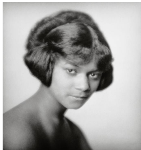
Belleza cubana, 1921

Los tipos. Aquí se recogen las fotografías publicadas en Taken from Life (1922) y London Types (1926), libros en los que Hoppé, a diferencia de los retratos presentes en la sección El estudio , va más allá del individuo para captar a aquél que constituye el estereotipo de un grupo social determinado. Formalmente también son diferentes: se circunscriben a mostrar la cabeza o el busto, con la intención de conseguir que la imagen del personaje sea lo más intensa posible.