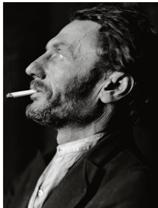
Tipo neoyorkino, 1921

Los tipos. Aquí se recogen las fotografías publicadas en Taken from Life (1922) y London Types (1926), libros en los que Hoppé, a diferencia de los retratos presentes en la sección El estudio , va más allá del individuo para captar a aquél que constituye el estereotipo de un grupo social determinado. Formalmente también son diferentes: se circunscriben a mostrar la cabeza o el busto, con la intención de conseguir que la imagen del personaje sea lo más intensa posible.