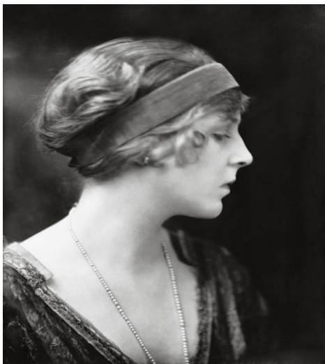
Lady Diana Cooper, 1916

Las bellas. En 1922 Hoppé publicó The Book of Fair Women [El libro de las bellas]. En el mismo se recogen 32 retratos femeninos que ponían en cuestión el canon de belleza occidental, al equiparar razas y grupos sociales, tahitianas pobres, con ricas y caucásicas ladies británicas. El libro originó un gran revuelo, más si tenemos en cuenta que en Hoppé coincidían la fama de retratista de la buena sociedad con la de ser un habitual de los concursos de belleza. Con el paso del tiempo, su mirada progresista y adelantada a su tiempo fue entendida como uno de los grandes hitos de la fotografía del siglo XX.