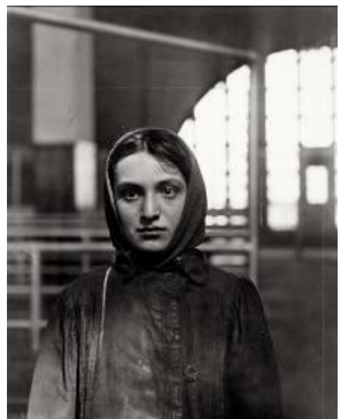
Judía en la Isla de Ellis , 1905.

Tal es el caso de Judía en la Isla de Ellis (1905), donde la toma frontal y a la altura en la que las miradas se cruzan refuerzan la conexión y el respeto mutuo.