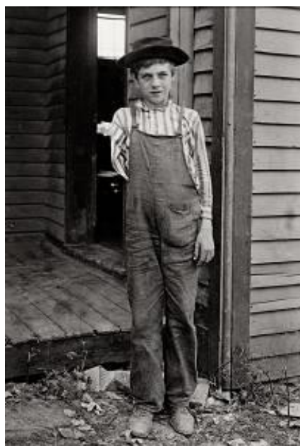
Niño que perdió un brazo manejando una sierra en una fábrica de cajas, 1909.

Durante sus tres primeros años como fotógrafo oficial del NCLC, Hine documentó el trabajo de los niños en campos, minas y fábricas, recolectando algodón, vendiendo periódicos o ayudando a sus familias a pelar nueces. Junto a las imágenes, anotaba cuidadosamente la altura, la edad y la historia laboral de cada uno de ellos, lo que le permitió, con el paso de los años realizar un trabajo comparativo. Sus fotografías de niños trabajadores causaron sensación y se publicaron en folletos del NCLC y en revistas populares como Everybody's y The Survey . En la imagen titulada por el propio Hine, Niño que perdió un brazo manejando una sierra en una fábrica de cajas (1909), vemos como su relación con los niños, la iluminación y el encuadre, hacen que sus imágenes informen a la vez que conmueven, poniendo ante la opinión pública las condiciones del empleo infantil.