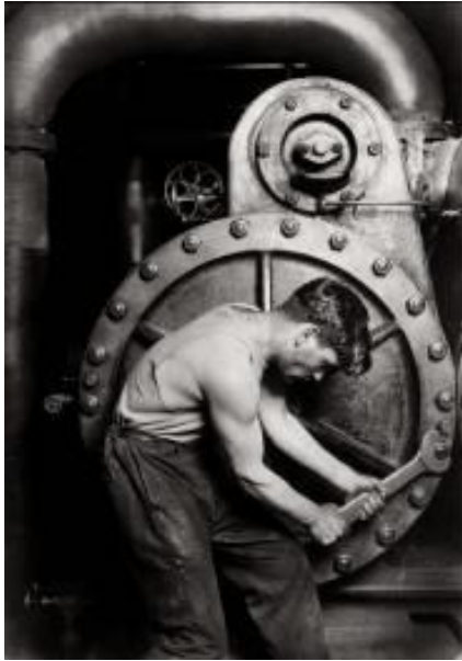
Mecánico en una bomba de vapor de una central eléctrica, 1920.

desplazados de guerra, y facilitaba a la Cruz Roja la concesión de ayudas económicas que la organización llevaba mucho tiempo reclamando sin éxito.