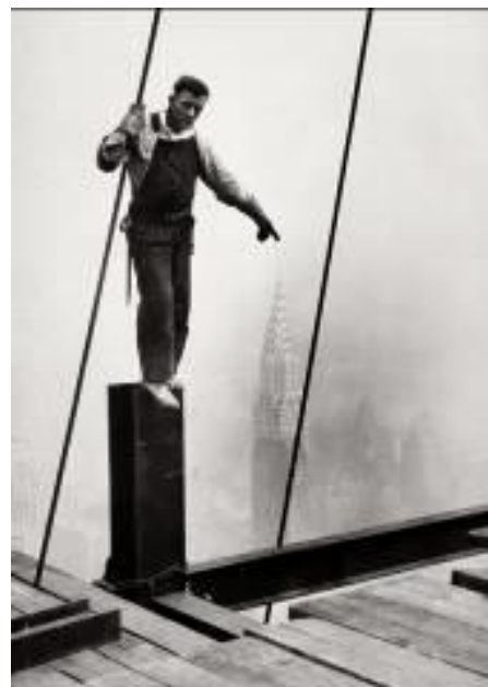
Metalúrgico sobre una viga, tocando la punta del edificio Chrysler, 1931.

A finales de la década de 1930, tanto el mundo de la reforma social como el de la fotografía habían cambiado. Hine encontraba cada vez menos oportunidades de empleo y, a pesar de su éxito temprano, pasó los últimos años de su vida dependiendo de la beneficencia y desestimado como anticuado o difícil por las mismas entidades reformistas que en otro tiempo le admiraban. Al mismo tiempo, artistas e historiadores del arte como Berenice Abbott y Beaumont Newhall empezaban a promover un nuevo estilo moderno del arte fotográfico que reconocía en Hine al antepasado espiritual de Walker Evans y Charles Sheeler.