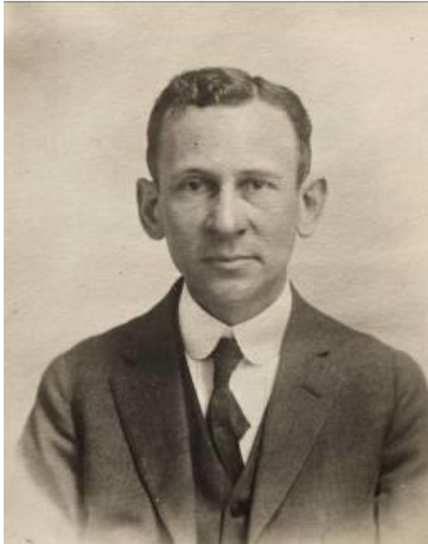
Anónimo. Retrato de Lewis Hine, ca. 1917.