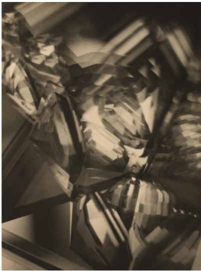
Vortografía, 1917 Impresión a la gelatina de plata, Colección de la George Eastman House (legado de Alvin Langdon Coburn), Rochester, Nueva York

Su vinculación con el mundo de la vanguardia artística londinense permitió su participación en el efímero pero influyente movimiento vorticista británico, liderado por el artista Wyndham Lewis y el escritor Ezra Pound entre 1914 y 1915. Este movimiento artístico estaba caracterizado por el arte geométrico y semiabstracto, basado en formas procedentes de las máquinas y la arquitectura, que le conferían muchas similitudes con el cubismo, el futurismo y el expresionismo.