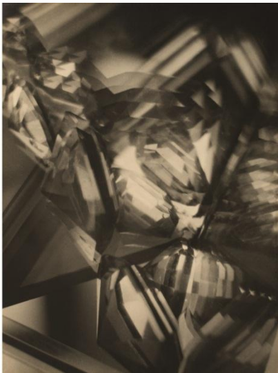
Vortografía, 1917 Impresión a la gelatina de plata, Colección de la George Eastman House (legado de Alvin Langdon Coburn), Rochester, Nueva York

Su vinculación con el mundo de la vanguardia artística londinense permitió su participación en el efímero pero influyente movimiento vorticista británico, liderado por el artista Wyndham Lewis y el escritor Ezra Pound entre 1914 y 1915. Este movimiento artístico estaba caracterizado por el arte geométrico y semiabstracto, basado en formas procedentes de las máquinas y la arquitectura, que le conferían muchas similitudes con el cubismo, el futurismo y el expresionismo.