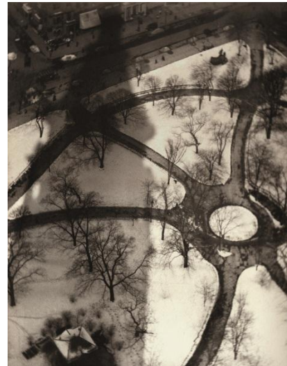
El pulpo, Madison Square Park, 1909 Impresión posterior al platino-paladio 31 Studio, Londres

Entre 1903 y 1912, Coburn fotografió la ciudad de Nueva York, donde trabajó intermitentemente durante tres años. Su prematuro interés por las vistas urbanas de la ciudad, la maquinaria industrial y las zonas portuarias, le llevó a crear imágenes futuristas de perspectivas y encuadres poco frecuentes para la época. Tal es el caso de El pulpo , de 1909, una fotografía casi abstracta tomada desde la cima del Metropolitan Tower que representa los senderos despejados de nieve del Madison Square Park; o Las mil ventanas , tomada en 1912, donde se manifiesta su admiración por las formas geométricas que invaden las composiciones de artistas como Max Weber y Wyndham Lewis, con quienes mantuvo una estrecha relación.