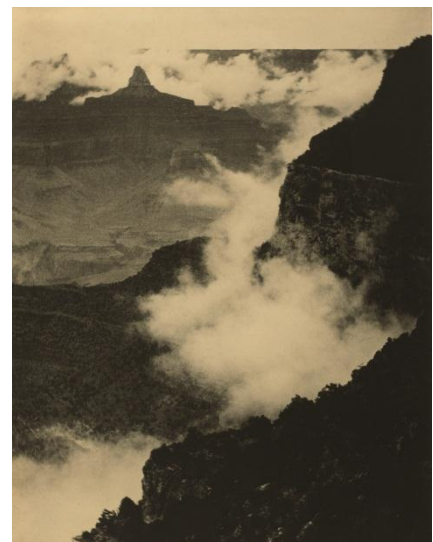
Nubes en el Gran Cañón, 1911 Impresión a la goma-platino

Durante la época que pasó en el oeste americano, entre 1911 y 1912, Coburn fotografió las extraordinarias e inquietantes vistas naturales del Gran Cañón. La naturaleza tan característica del paisaje le obligó a alterar el punto de vista convencional y a hacer la toma desde un ángulo más elevado. Por otro lado, su dominio del proceso a la goma-platino mediante el uso de unos pigmentos específicos en la capa de goma, le permitió dotar a esta serie de los tonos de marrón rojizo tan característicos del paisaje americano. Estas vistas en picado del Gran Cañón inspiraron a Coburn, de regreso a Nueva York en 1912, para crear sus modernas fotografías tomadas desde lo alto de los rascacielos.