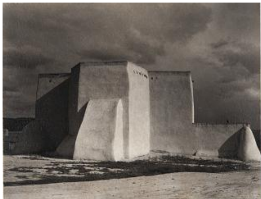
Church, Ranchos de Taos, New Mexico [Iglesia, Ranchos de Taos, Nuevo México], 1930

humano de la calle con perspectivas tomadas desde altos edificios que se tornan abstractas a vista de pájaro, y escenas del ferry y el puerto, todo ello acompañado por la poesía de Walt Whitman.