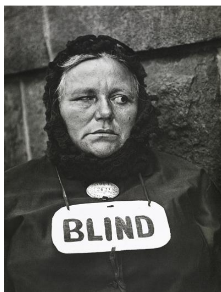
Blind Woman, New York [Mujer ciega, Nueva York], 1916 (negativo), década de 1940 (copia) Copia a la gelatina de plata Colecciones FUNDACIÓN MAPFRE, FM000886 © Aperture Foundation Inc., Paul Strand Archive

La exposición arranca con las primeras obras de Strand, realizadas en la década de 1910, y en las que se aprecia su rápido dominio del imperante estilo pictorialista. Esta sección también presenta su evolución hacia las innovadoras fotografías de 1915–17, obras que exploran nuevas temáticas del paisaje urbano de Nueva York e ideas estéticas novedosas que lo acercan a la abstracción. Estas nuevas orientaciones en la fotografía de Strand ponen de manifiesto su creciente interés tanto por la pintura contemporánea —especialmente por el cubismo y por la obra de los artistas estadounidenses encabezados por Alfred Stieglitz— como por el descubrimiento de la fotografía como un medio esencial para dar expresión a la modernidad.