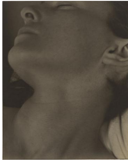
Rebecca, New York [Rebecca, Nueva York], 1922

Durante los años veinte —un periodo a menudo denominado “la era de las máquinas”— Strand quedó cautivado por la capacidad de la fotografía para captar los fascinantes detalles de piezas mecánicas, a la vez que sus ideas acerca de la naturaleza del retrato comenzaron a ampliarse de un modo considerable. Estas nuevas y variadas inquietudes pueden apreciarse en la belleza sensual de los primeros planos de su esposa, y en frescos y profundos estudios sobre su nueva cámara de cine. Strand hizo extensivas estas ideas a una serie de fotografías tomadas en lugares fuera de Nueva York, tales como Maine, donde temas aparentemente comunes, como un tronco, una roca, o la simple vegetación, dieron como resultado imágenes sorprendentemente innovadoras.