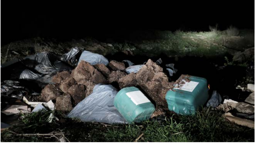
GUILLERMO FERNÁNDEZ, serie Los santos inocentes , 2019

Los santos inocentes es un relato fotográfico de la provincia de Granada en la actualidad, un territorio que vuelve a ser “reino”: el reino de la marihuana. Guillermo Fernández explora el paso de la noche al día en una zona rural deprimida próxima a la ciudad y revela la actividad a la que se ve obligada a dedicarse la “generación perdida” tras la crisis económica de 2008 y el inmediato estallido de la burbuja inmobiliaria. Con este proyecto, Guillermo Fernández busca las similitudes entre pasado y presente, entre la época que retrata Miguel Delibes en Los santos inocentes (1981) y la actual, entre el sistema impuesto por aquellos caciques y el que actualmente autoimpone a miles de jóvenes la aceptación de que no hay futuro para ellos. El autor nos lleva por una serie de paisajes nocturnos de antiguos olivares, caminos rurales y cortijos típicos alumbrados por una luz artificial que marca el camino a seguir y sirve de nexo de unión entre los diferentes escenarios planteados. La trama culmina con el amanecer, cuando la luz natural sustituye a la artificial y “alumbra” la realidad escondida tras la noche.