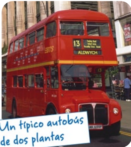
Un típico autobús de dos plantas