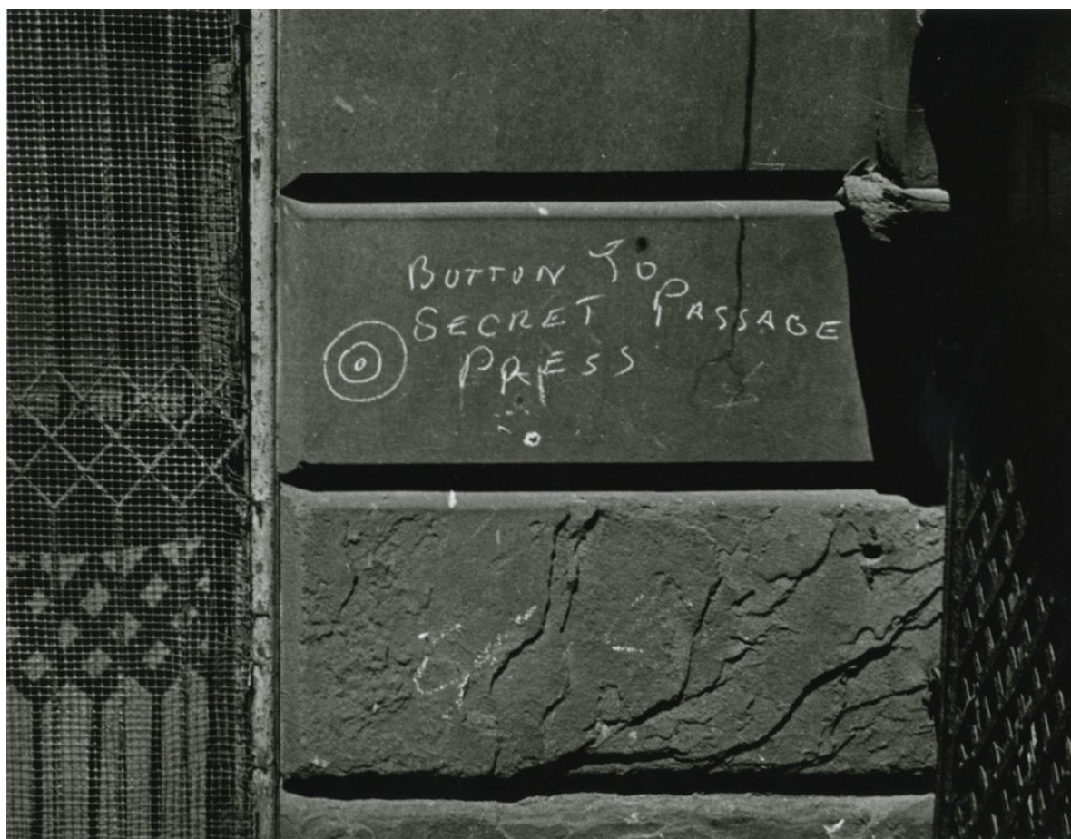
Helen Levitt New York, c.1938 Gelatin Silver Print © Film Documents LLC, courtesy Zander Galerie, Cologne

En 1937 es contratada por el New York City Federal Art Project como profesora de arte para niños en una escuela de East Harlem. Levitt se sintió atraída por los dibujos a tiza que encontraba en su trayecto al trabajo realizados por los niños en la calle, en una época en la que el arte folclórico y primitivo estaba en pleno apogeo en Estados Unidos.