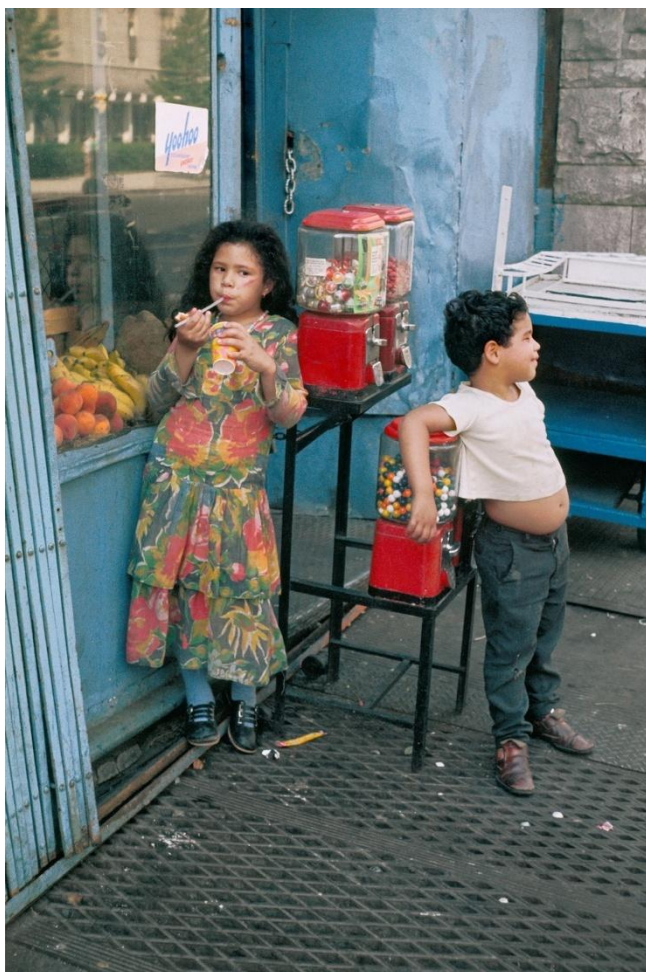
Helen Levitt New York, 1971 Dye transfer

A finales de 1958 Levitt solicitó por tercera vez una beca Guggenheim, para experimentar con «las técnicas más novedosas de la fotografía en color» y se le concedió al año siguiente. La artista siguió trabajando igual que si lo estuviese haciendo en blanco y negro en una época en la que el uso del color no era habitual; además, la película que utilizaba (diapositivas) tenía un coste muy elevado para ella. Durante estos años, y más tarde, en las décadas de 1970 y 1980, Levitt fotografió en color en las calles de Nueva York, en algunos de los barrios más peligrosos de la ciudad en aquel momento, como el Bronx.