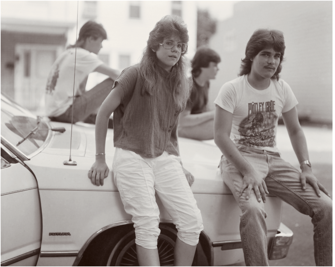
Judith Joy Ross, Sin título, Easton, Pensilvania, 1988

En 1985 participa en la exposición New Photography en el MoMA. En 1992 recibe el premio Charles Pratt Memorial y, un año después, sus fotografías se presentan en una muestra individual en el San Francisco Museum of Modern Art y son incluidas en exposiciones colectivas fuera de Estados Unidos, en la National Gallery of Canada de Ottawa y en el noruego Lillehammer Art Museum.