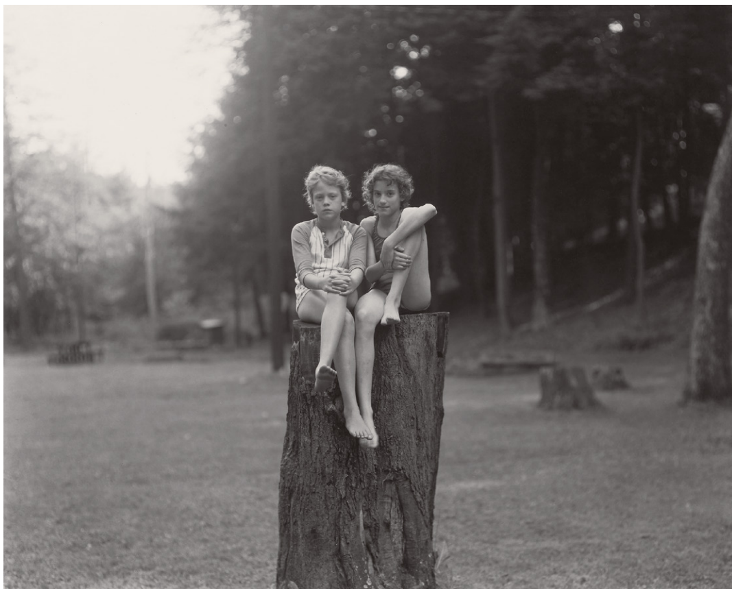
Judith Joy Ross, Sin título, Eurana Park, Weatherly, Pensilvania, 1982

Su obra, centrada definitivamente en el retrato a partir de 1979, marca un punto de inflexión en el género. «Con una cámara, puedo llegar a ver y entenderlo todo», ha afirmado la artista. Tardó algunos años en entender que la fotografía la ayudaba a hacer más comprensible el mundo en el que vivía, pero, a partir de ese momento, no dejó de utilizar este medio para responder a preguntas de carácter existencial: cómo luchar contra la tristeza, cómo se forma y se desarrolla la identidad de una persona, cuáles son los motivos que hacen que la vida merezca ser vivida, por qué existe la injusticia o la barbarie de la guerra, entre otras cuestiones.