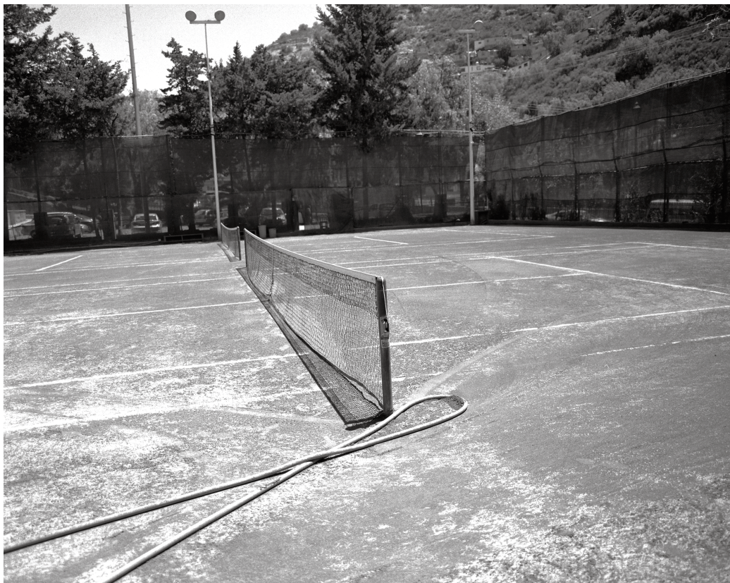
De la serie «Faute d'argent (Ocho piezas cortas)», 2016-2020. Cortesía del artista