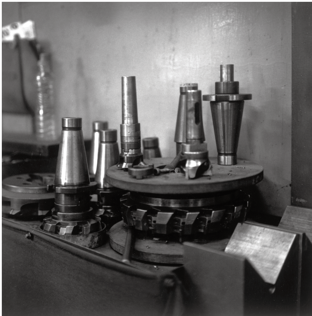
Portaherramientas de fresadora Zayer. De la serie «Trabajo anónimo». Iracheta S. L., Can Ricart, Poblenuou, junio-julio de 2005. 2005