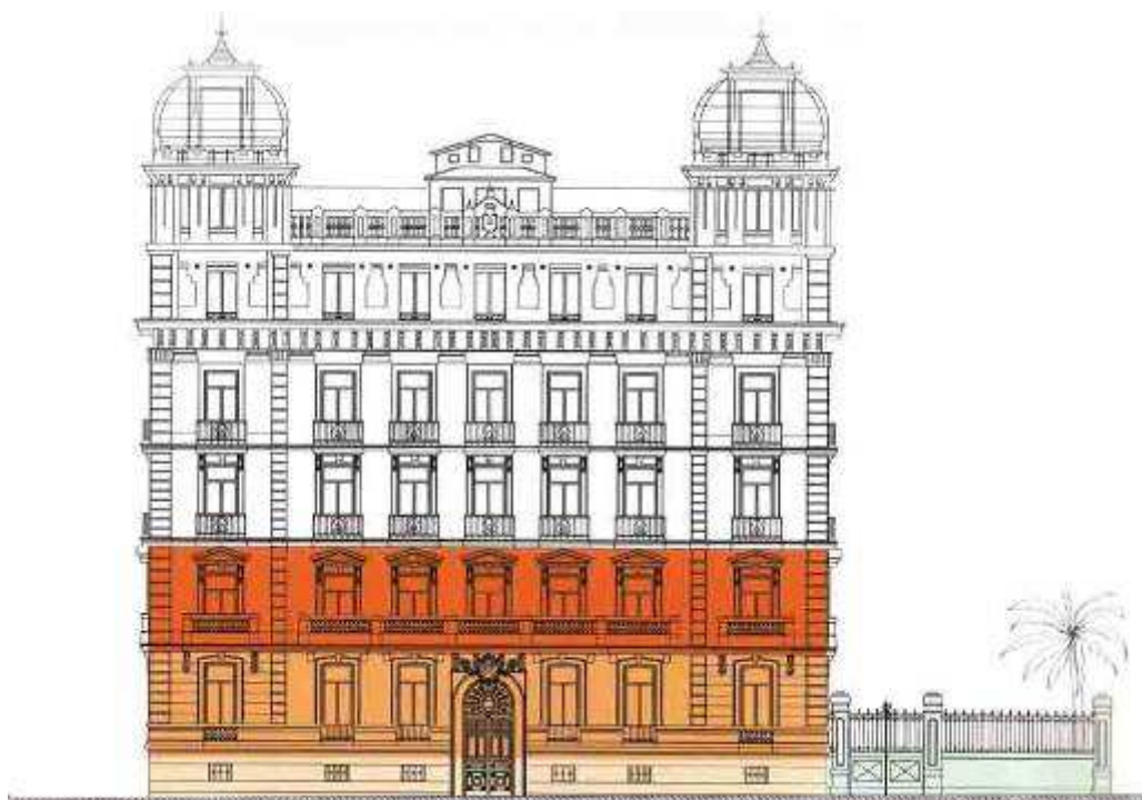
Alzado del edificio de la FUNDACIÓN MAPFRE, Paseo de Recoletos 23.

Tras una serie de obras de acondicionamiento y reestructuración, el edificio cuenta con un área de exposiciones con una superficie aproximada de 1.000 m 2 , dividida en tres salas: una en la planta baja (300 m 2 ), otra en la planta primera (400 m 2 ) y una tercera en la planta sótano (300 m 2 ), que albergarán la programación que se venía desarrollando en la sala de exposiciones de FUNDACIÓN MAPFRE en Avd. General Perón 40 (Sala AZCA), además de un espacio destinado a mostrar una parte de nuestras colecciones, en la que en esta ocasión se presenta, por primera vez en España, la serie completa de Las hermanas Brown , de Nicholas Nixon, así como las últimas adquisiciones de la colección de dibujos.