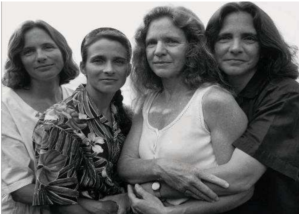
Nicholas Nixon, Hermanas Brown, 1995 COLECCIONES MAPFRE © Nicholas Nixon.

El fotógrafo recuerda que la serie surgió de manera muy casual: “A todos nos gustó mucho una fotografía, y de ahí el impulso del que salió la idea. La misma que se les ocurre a la mayoría de los padres”