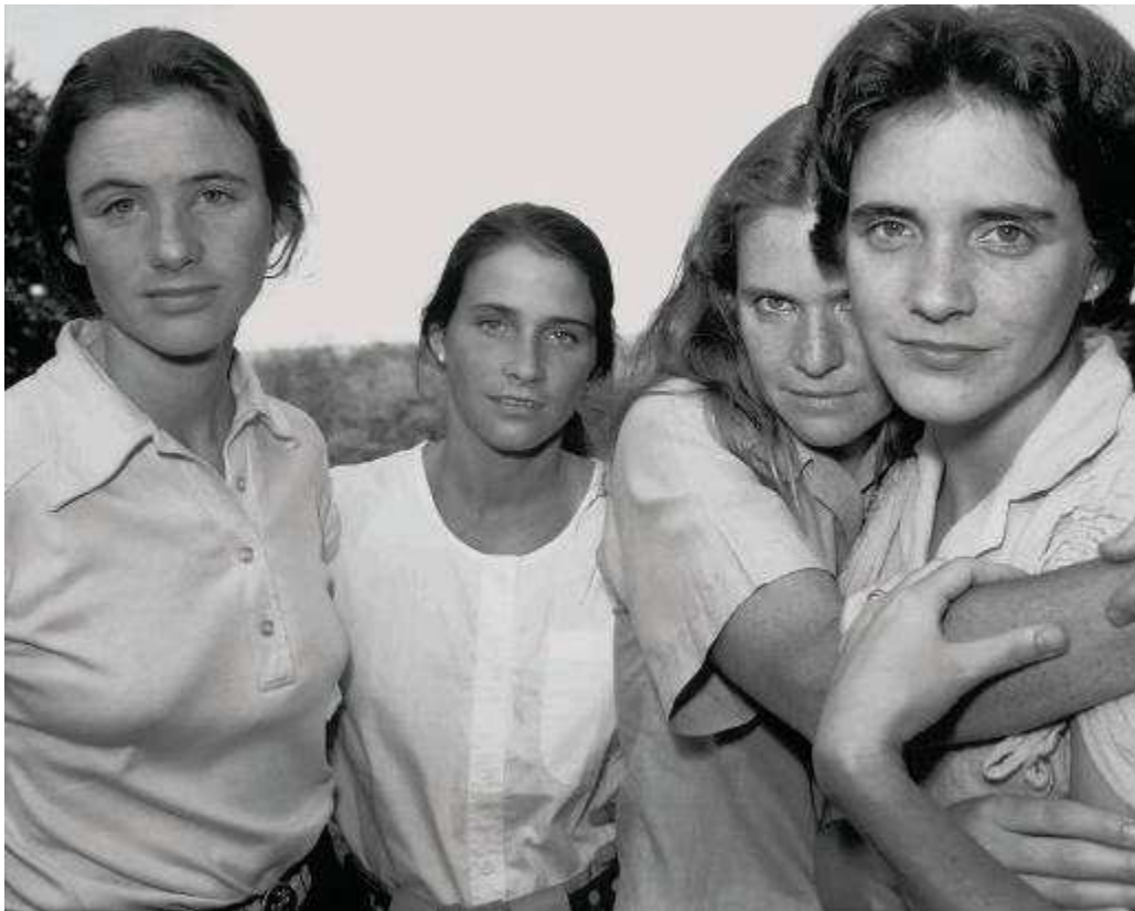
Nicholas Nixon, Hermanas Brown, 1980

Nixon desarrolla su trabajo en series. Durante un periodo de tiempo se centra en un proyecto que le interesa emocional y artísticamente. Así, trabaja con ahínco en ese proyecto, para luego pasar al siguiente.