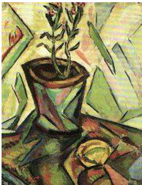
Joan Miró El tiesto de flores y el limón , 1916 Colección LL-A

De forma paralela a la exposición, FUNDACIÓN MAPFRE amplía su oferta de actividades didácticas con un programa de Visitas-Taller, dedicado los sábados y domingos a las familias y el resto de la semana a visitas escolares de todos los niveles educativos. Bajo el título “La España Moderna”, la actividad consta de dos partes: un recorrido participativo por la exposición y un taller plástico, donde los alumnos realizarán una obra relacionada con el tema del recorrido.