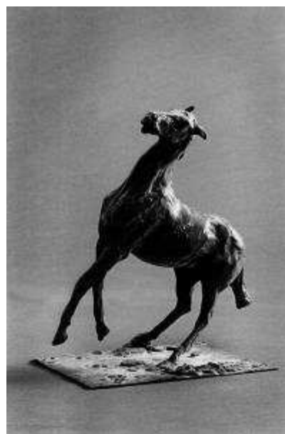
Cheval se cabrant MASP, Museu de Arte de São Paulo Assis Chateaubriand, Sao Paulo, Brasil © Frank Horvat

Caballos, bailarinas y toilettes constituyen los motivos en los que Degas plasmó sus investigaciones; sobre estos temas construye su universo personal, llevando la pintura a uno de sus momentos más admirables.