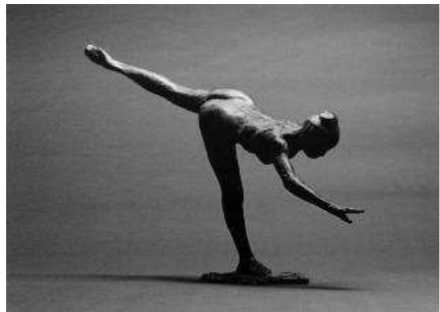
Danseuse, grande arabesque, troisième temps autrefois appelée deuxième étude MASP, Museu de Arte de São Paulo Assis Chateaubriand, Sao Paulo, Brasil

Claude Roger-Marx contó que había oído decir a Degas: “Un cuadro es una obra artificial, fuera de la naturaleza, y exige tanta astucia como la perpetración de un crimen”. Esta sentencia muestra lo complejo del proceso de la pintura en Degas. Es conocida la dificultad de este artista para dar por terminada una obra, y el hecho de que retomara cuadros propios de casa de sus amigos para replantearse algo más.