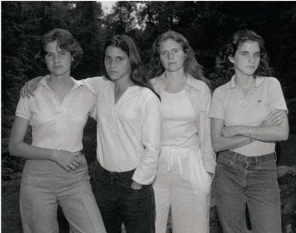
Nicholas Nixon, Hermanas Brown, 1975 COLECCIONES MAPFRE © Nicholas Nixon.

Nicholas Nixon (Detroit, 1947) es uno de los fotógrafos más reputados del panorama internacional. Profesor de fotografía del prestigioso Massachusetts College of Art, de Boston, ha realizado exposiciones individuales en los principales museos de arte contemporáneo del mundo, entre las que destacan las presentadas en el Art Institute of Chicago (1985), Museum of Fine Arts de Boston (1988), Museum of Modern Art de Nueva York (1988), Victoria and Albert Museum de Londres (1989), San Diego Art Museum (1991), Musée d'Art Moderne de París (1995), National Gallery of Art de Washington (2005) o el Saint Louis Art Museum (2007).