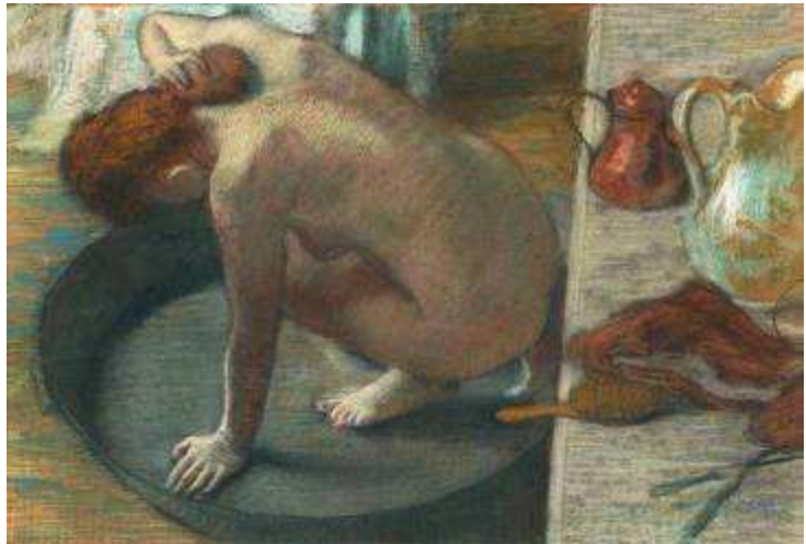
Le tub , ca. 1886 París, Musée d'Orsay

Del proceso de dibujar insistentemente el cuerpo humano, inquiriendo en su forma y su expresión, parece haber nacido en Degas la necesidad de hacer escultura. Dibujar era, para el artista, un modo de pensar; modelar, otro. Degas modelaba insistentemente en cera pequeñas figurillas que, siempre frágiles, podía retocar. Cada escultura encierra una delicada poesía que se plasma en cada una de ellas, en cada pequeño instante que se plasma en las sutiles variaciones de cada pose.