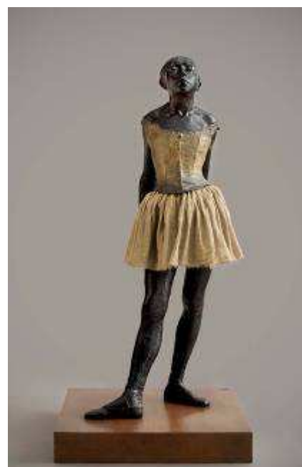
Petite Danseuse de quatorze ans, 1878-1881 MASP, Museo de Arte de Sao Paulo

Del proceso de dibujar insistentemente el cuerpo humano, inquiriendo en su forma y su expresión, parece haber nacido en Degas la necesidad de hacer escultura. Dibujar era, para el artista, un modo de pensar; modelar, otro. Degas modelaba insistentemente en cera pequeñas figurillas que, siempre frágiles, podía retocar. Cada escultura encierra una delicada poesía que se plasma en cada una de ellas, en cada pequeño instante que se plasma en las sutiles variaciones de cada pose.