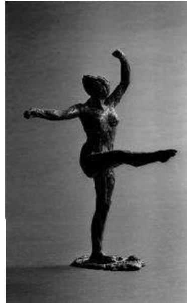
Danseuse, position de quatrième devant sur la jambe, première étude MASP, Museu de Arte de São Paulo Assis Chateaubriand, Sao Paulo, Brasil

Junto con algunos retratos, paisajes y obras de asunto histórico, los principales motivos en los que se basaron las investigaciones de Degas fueron las bailarinas, las mujeres en su aseo y los caballos de carreras.