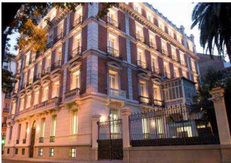
Vista exterior del edificio de la FUNDACIÓN MAPFRE, Paseo de Recoletos 23.

El edificio que alberga las nuevas salas fue construido entre 1881 y 1884 por el arquitecto Agustín Ortiz de Villajos, para la duquesa de Medina de las Torres. Originalmente, la edificación presentaba un alzado de cuatro plantas y semisótano pero, en 1910, se resaltó la monumentalidad del palacio mediante la construcción de dos torreones sobre los cuerpos de las esquinas, manteniendo las decoraciones verticales y horizontales del estuco y empleando de nuevo los machones de ladrillo.