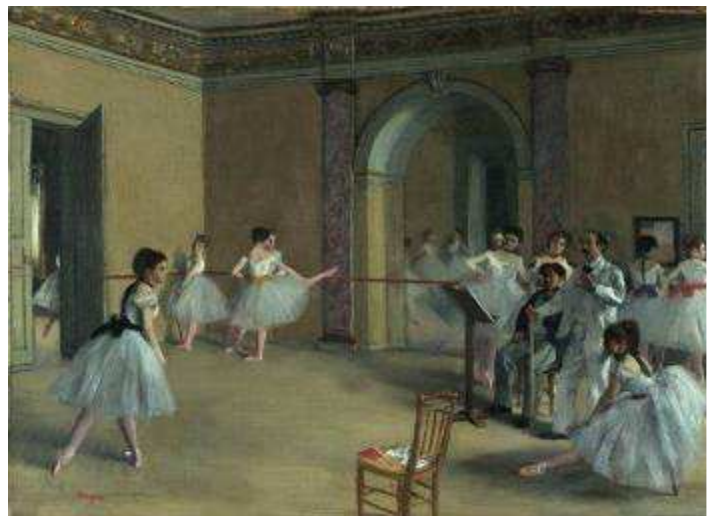
Le foyer de la danse à l'Opéra de la rue Le Peletier, 1872 París, Musée d'Orsay

Frente a la supuesta artificiosidad de las bailarinas, Degas despoja a la mujer de todo artificio. Al margen de la clase social de la retratada, en las toilettes de Degas, la mujer queda reducida al estado de “hembra” que se asea. Joris-Karl Huysmans observaba en los desnudos de Degas una “atenta crueldad”, un “odio paciente”; consideraba que el artista envilecía a la mujer al representarla como algo natural, en las “humillantes poses” que debía adoptar para sus cuidados íntimos.