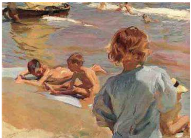
Joaquín Sorolla Niños en la playa. Valencia, 1916