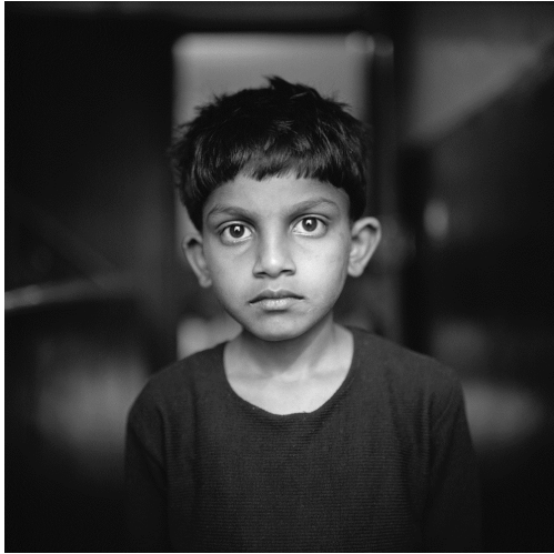
Manita, India, 2007

Ladli, India (2005-2008). Esta serie continúa el trabajo realizado en Moksha y completa el retrato sobre la discriminación que sufren las mujeres. Durante estos años, Fazal Sheikh ha retratado a mujeres de todas las edades y ha recogido el testimonio de su padecimiento.