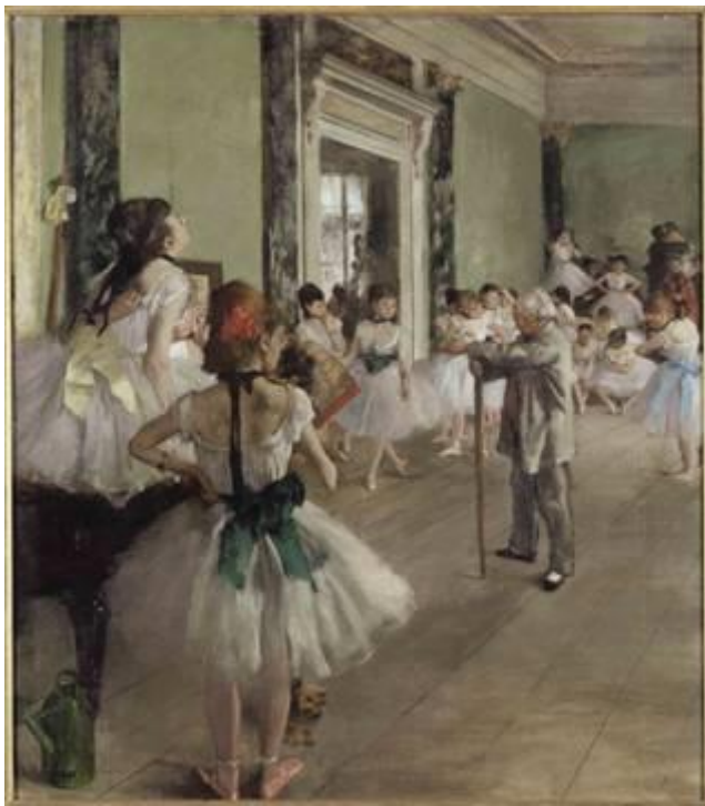
Edgar Degas, La classe de danse , 1873 Musée d'Orsay, París

Frente a la renovación estilística de Monet, Renoir o Cézanne, Degas representa la renovación del clasicismo. Su modernidad no se apoya en una pincelada vibrante o en la planitud del lienzo, sino en una estética fragmentaria, que le permite crear la ilusión de representar un instante de la vida moderna.