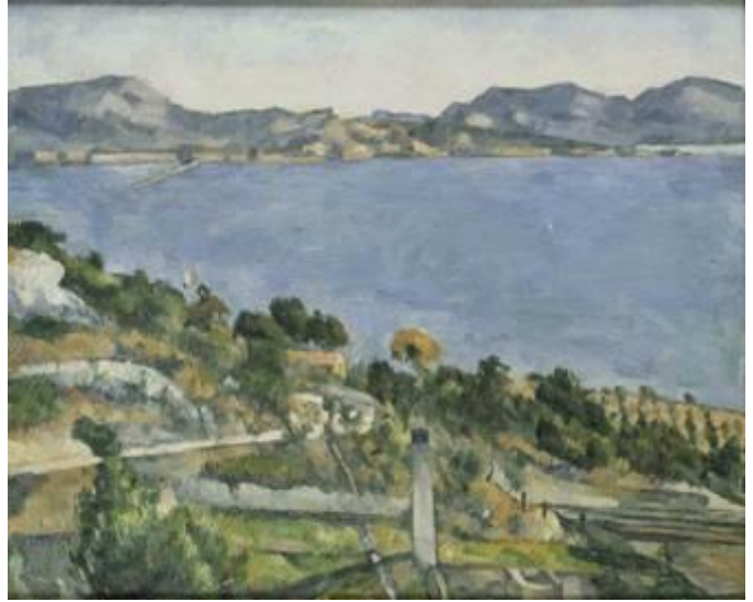
Paul Cézanne, Le golfe de Marseille vu de L'Estaque Musée d'Orsay, París

Frente a la renovación estilística de Monet, Renoir o Cézanne, Degas representa la renovación del clasicismo. Su modernidad no se apoya en una pincelada vibrante o en la planitud del lienzo, sino en una estética fragmentaria, que le permite crear la ilusión de representar un instante de la vida moderna.