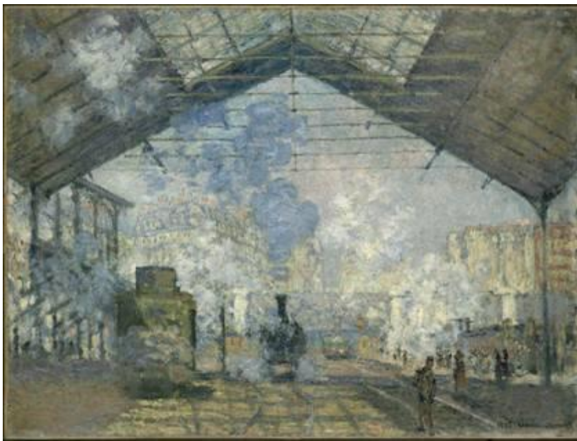
Claude Monet, La gare Saint-Lazare , 1877 Musée d'Orsay, París

La historia del impresionismo clásico se recorre en esta exposición a través de obras imprescindibles para la historia del arte, lo que pone también de manifiesto la importancia del Musée d'Orsay como el gran referente mundial de este periodo: