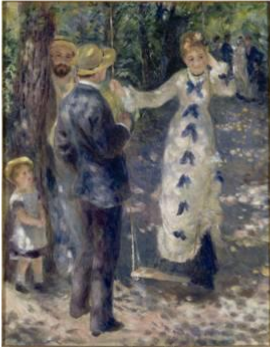
Auguste Renoir, La balançoire , 1876 Musée d'Orsay, París

la técnica impresionista, las pinceladas pequeñas y vibrantes que permiten captar el continuo devenir de los efectos atmosféricos. Frente a la fuerza de Monet, Renoir aparece como un artista más sensual, más delicado en sus retratos, quizás por las sutiles irisaciones de su paleta veneciana, que se muestran con esplendor en obras como El Columpio .