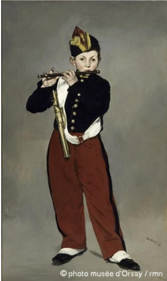
Edouard Manet, El pífano , 1866 Musée d'Orsay, París

Del 15 de enero al 22 de abril de 2010, FUNDACIÓN MAPFRE presentará Impresionismo. Un nuevo Renacimiento , una exposición que recorre la historia del más importante movimiento artístico moderno, a través de las grandes obras maestras del MUSÉE D'ORSAY. La exposición viajará posteriormente al Fine Arts Museum de San Francisco y al Frist Center for Visual Arts de Nashville.