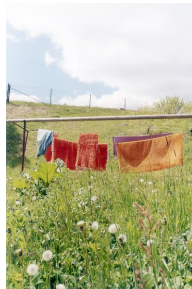
Sin título , de la serie Rokytník , 1991

Rokytník es la primera serie de la trayectoria de Hanzlová y es también el nombre del pueblo bohemio en el que creció. La caída del régimen comunista en 1989 permite a la artista volver a su país natal, donde se enfrenta a un pasado lejano y extraño, en un lugar en el que el tiempo parecía haberse parado. Hanzlová se concentra en los retratos, paisajes y momentos cotidianos, asuntos que caracterizarán su obra posterior. Las fotografías de Rokytník están llenas de melancolías y rencuentros, y muestran la lejanía del trepidante ritmo de las ciudades occidentales, en las que la artista se había integrado.