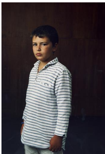
Sin título , de la serie There is Something I Don't Know , 2011

las fotografías presentadas fueron tomadas durante viajes que la artista realizó a Madrid en la preparación de la muestra.