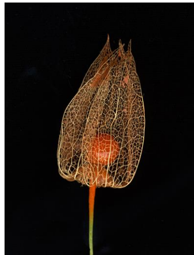
Sin título , de la serie Flowers , 2009 © Jitka Hanzlová

Flowers se presenta en forma de vanitas : flores cortadas en distintos procesos de vida que son testimonio de la transformación y del cambio perpetuo. Para este trabajo, Hanzlová recurre a la tradición pictórica en lugar de inspirarse en las numerosas fotografías que, a lo largo del siglo XX, han relacionado las flores con los órganos sexuales. Esta serie, en la que la artista continúa trabajando en la actualidad, se muestra también por primera vez en la exposición y en el catálogo de FUNDACIÓN MAPFRE.