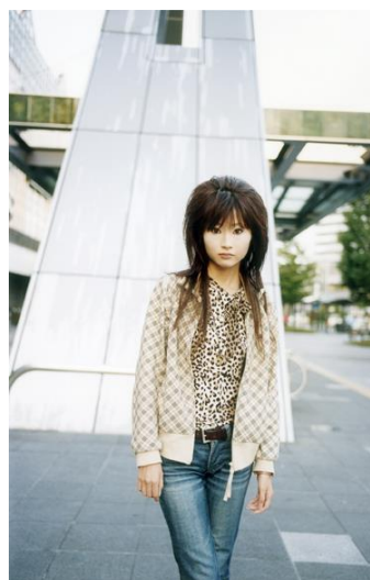
Sin título , de la serie Cotton Rose , 2004 © Jitka Hanzlová

En 2004 es invitada a participar en el proyecto European Eyes on Japan [Ojos europeos sobre Japón], en el que artistas europeos recorren el país nipón para plasmar su visión de sus gentes y lugares. Cotton Rose es el resultado de dos años de viajes a la prefectura de Gifú. La artista retoma sus intereses, captando a las personas en armonía con el paisaje. Sus fotografías carecen de la típica visión exótica oriental, aunque el espíritu japonés está presente de manera esencial.