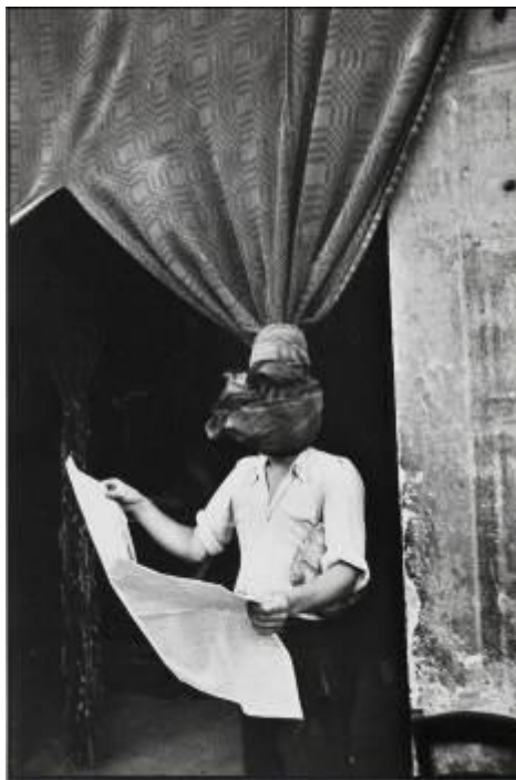
Livorno, Toscana, Italia, 1933

están muy involucradas en la lucha revolucionaria. A su regreso a París en 1936, Cartier-Bresson se ha radicalizado: participa con regularidad en las actividades de la Asociación de Escritores y Artistas Revolucionarios (AEAR), y empieza a trabajar para la prensa comunista.