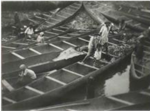
Costa de Marfil, África, 1930

La obra fotográfica de Henri Cartier-Bresson es el resultado de la combinación de múltiples factores: cierta predisposición artística, la tenacidad en el aprendizaje, el ambiente de la época, sus aspiraciones personales y sus magníficas relaciones. La producción del autor se inicia en la década de 1920, caracterizada por esa doble vertiente de pintura y fotografía practicadas como afición; luego se va desarrollando y asentando en algunos hitos a lo largo del tiempo, como su viaje a África de 1930-1931. En todos sus trabajos se refleja su amor por el arte, las horas empleadas en leer o en contemplar cuadros en los museos, la marca