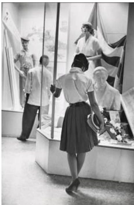
Camagüey, Cuba, 1963

En febrero de 1947 Cartier-Bresson inaugura su primera gran retrospectiva institucional en el Museo de Arte Moderno (MOMA) de Nueva York. Meses más tarde, junto con Robert Capa, David Seymour, George Rodger y William Vandivert, funda la agencia Magnum, que se convertirá rápidamente en una de las referencias mundiales en materia de reportajes gráficos de calidad. Tras su exposición en el MOMA, Cartier-Bresson pudo decidirse por ser únicamente artista, pero prefirió convertirse plenamente en reportero al comprometerse con la aventura que representaba Magnum. Desde 1947, y hasta principios de la década de 1970, se multiplicaron sus viajes y reportajes por todos los rincones del mundo, trabajando para la práctica