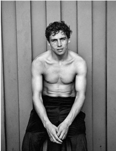
Boxeador VI, Santiago, de la serie Boxeadores. El combate contra el ángel, 1987

En 1987 Paz Errázuriz quiso explorar un mundo tan supuestamente viril como el del boxeo. Acudió en un principio a hacer algunas averiguaciones al Club México de Santiago pero fue rechazada con el argumento de que las mujeres no estaban autorizadas a penetrar en un recinto masculino de dichas características. Finalmente sí pudo llevar a cabo su proyecto visitando la Federación chilena de Boxeo. El resultado de sus reiteradas visitas es una serie de imágenes –la serie El combate contra el ángel , 1987- de hombres cuyo aspecto vulnerable hace dudar de la victoria a la que aspiran pues Errázuriz los muestra fuera del ring o dispuestos a iniciar el entrenamiento. Sin embargo, más que una musculatura en su esplendor físico, vemos sobre todo cansancio, agotamiento y también precariedad y fragilidad.