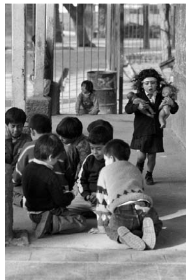
Centro de acogida, Santiago, de la serie Niños, 1994

Las edades extremas de la vida (niñez y vejez) son las más representadas por la artista en su obra en la que incluye una mirada crítica hacia la infantilización social que afecta a los ancianos, así como otras cuestiones cómo la presencia del trabajo en las personas mayores. Consciente del culto a la juventud y a la belleza de nuestra época, la actitud audaz de la fotógrafa le ha llevado a adentrarse en un asunto tabú como el de la desnudez desinhibida de algunas personas de edad avanzada (serie Cuerpos ), o en el del disfrute del tiempo de ocio (serie Tango ).