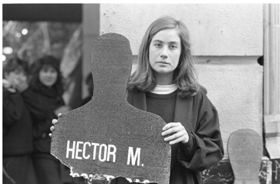
Mujeres por la vida, de la serie Protestas, 1988

Como ya hemos mencionado Errázuriz inició su trayectoria en un periodo de la historia de Chile cargado de acontecimientos políticos: el gobierno de la Unidad Popular (1970-1973) y la dictadura fascista (1973-1990). A ello se suma su decidido compromiso en la lucha a favor de los derechos humanos, lo que hizo que quisiera registrar todos aquellos movimientos sociales. Desde 1981, estando activa en la Asociación de fotógrafos independientes (AFI), salió en ocasiones a la calle en grupo