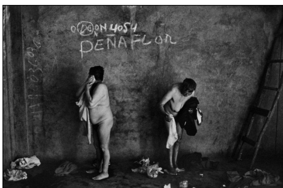
Baño X, de la serie Antesala de un desnudo, 1999

Huyendo de una visión miserabilista, el ojo de Errázuriz se centra en los lazos humanos basados en el cariño y la ternura, en las relaciones de pareja creadas en el psiquiátrico. Las fotos se llenan de abrazos, de manos que se agarran, de cuerpos que se juntan. La aportación principal de El infarto del alma (1992-1994) consiste en la valoración ante todo de la individualidad de los sujetos retratados y de las vinculaciones afectivas tejidas en el internamiento.