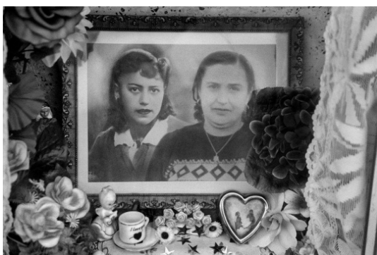
Memento II, de la serie Memento Mori, 2004