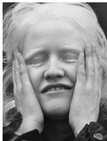
Ceguera I, de la serie Ceguera, 2003

Otra serie posterior, titulada La luz que me ciega (2010) la condujo al pequeño poblado de El Calvario, cerca de la localidad de Paredones, en la VI región de Chile. En ese lugar conocerá a una familia aquejada por la acromatopsia, una enfermedad congénita por la cual la realidad es percibida en blanco y negro. Además, esa falta de percepción del color va acompañada de una visión que está alterada gravemente. Las imágenes captan un drama contemporáneo de un pueblo en cuyo cementerio se repiten los mismos apellidos lo que desvela una larga historia de incestos.