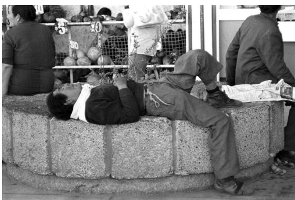
Dormidos X , de la serie Los dormidos , 1979

En 1980 Paz Errázuriz lleva a cabo su primera exposición individual titulada Personas , en el Instituto Chileno-Norteamericano de Santiago y un año después funda con sus compañeros de profesión la Asociación de Fotógrafos independientes (AFI).