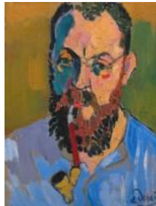
André Derain, Henri Matisse, 1905 Tate, Londres