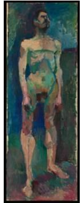
Henri Matisse, Académie d'homme, 1902 Musée Cantini, Marsella

La exposición comienza con una sección dedicada a los primeros intentos pictóricos llevados a cabo por los artistas que formarían el grupo fauve durante sus años de formación. Los primeros contactos entre ellos se remontan a la década de 1890, cuando Henri Matisse, Georges Rouault, Albert Marquet, Henri Manguin y Charles Camoin coincidieron en el estudio de Gustave Moreau en la École des Beaux-Arts de París. Moreau fue un maestro atípico dentro de la rigidez del mundo académico. Incitaba a sus alumnos a expresarse libremente a través del color y a buscar la autonomía pictórica. El grupo de alumnos de Moreau, liderado por Matisse y al que pronto se sumaron otros jóvenes artistas como Jean Puy, André Derain y Maurice de Vlaminck, comenzó muy pronto a experimentar con los colores puros y las pinceladas expresivas de la pintura moderna de Van Gogh, Gauguin y Cézanne que se exponía esos años en las galerías más atrevidas de París. Pintaban a menudo juntos, motivados por un fuerte espíritu de emulación, como se puede apreciar en los estudios de modelo desnudo que transmiten el ambiente del taller compartido. Estas academias, junto a las naturalezas muertas y a las escenas de interior que forman esta sección permiten apreciar el eclecticismo y la audacia de estos años de formación y descubrimientos.