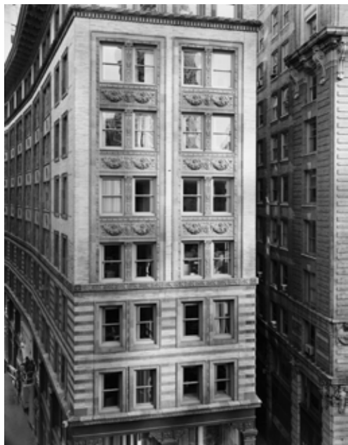
Vista de Washington Street, Boston [Vista hacia el este desde Pi Alley, Boston], 2008