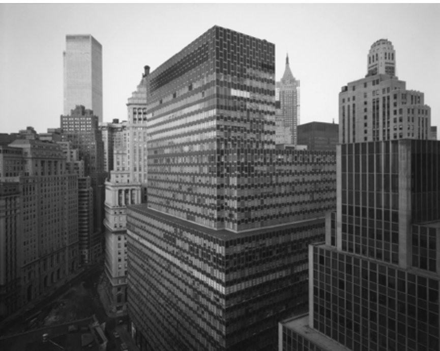
Vista de Battery Plaza, Nueva York, 1975

Algunos de los elementos que encontramos en su primera serie importante, las Vistas de ciudades , ya aparecen en estas fotografías: la claridad, la definición, la visión desde un punto elevado.