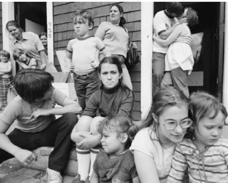
Hyde Park Avenue, Boston, 1982