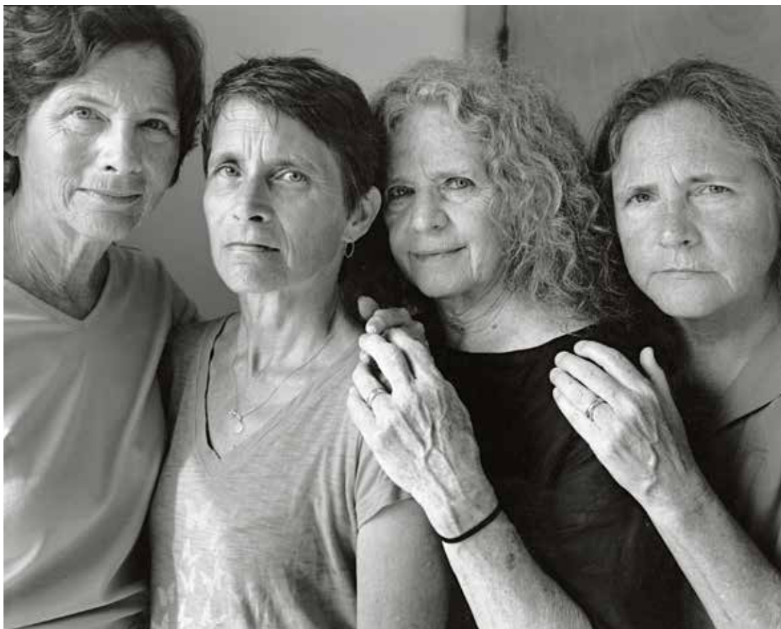
Las Hermanas Brown, 2016