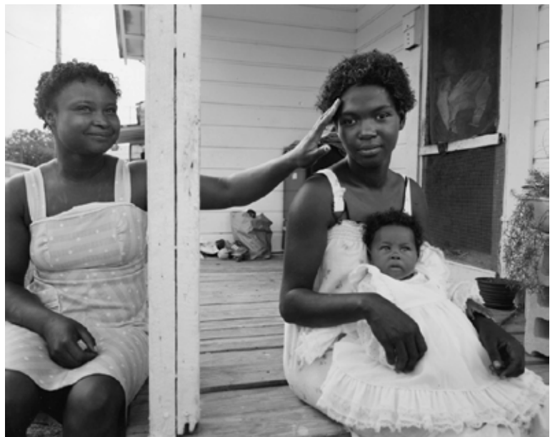
Plant City, Florida, 1982