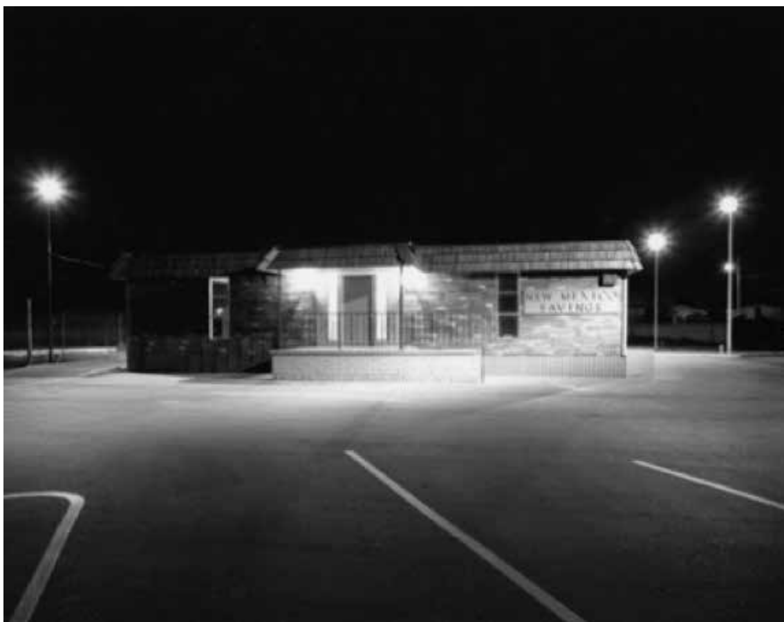
New Mexico Savings Bank, Wyoming Street NE, Albuquerque, 1974

La primera cámara que tuvo Nicholas Nixon fue una Leica, siguiendo el modelo de Cartier-Bresson, cuya obra es de las primeras que le impactan. Pero muy pronto empieza a explorar las posibilidades de las cámaras de mayor formato, con una de 4 x 5 pulgadas. Con ella toma las imágenes que abren esta exposición: vistas de los alrededores de la ciudad de Albuquerque, unos espacios nuevos en la frontera entre la ciudad y el desierto, un trabajo de sorprendente madurez para un joven estudiante de fotografía.