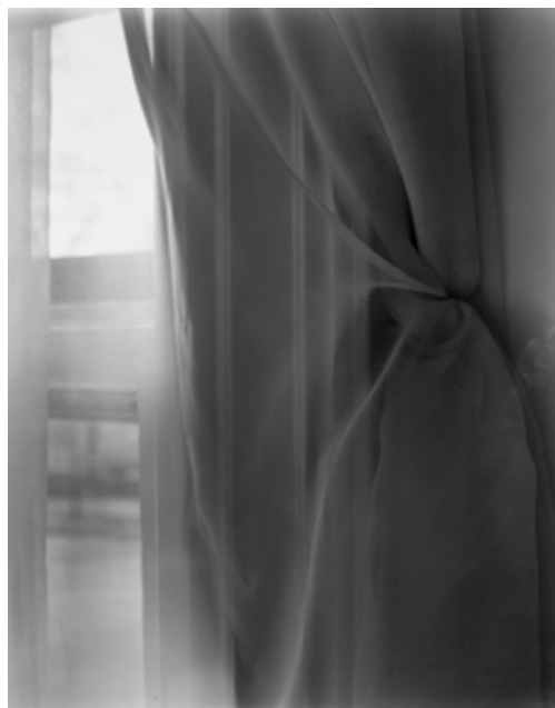
Cortina de nuestro dormitorio, Brookline, 2017

La mirada de Nixon se detiene en las escaleras de su casa, donde hay unas hojas esparcidas como constelaciones, en las cortinas mecidas por el aire, en la mirada de un personaje en un cuadro que siempre estuvo ahí, en la última luz de la tarde que genera un juego de sombras en el porche. La luz, siempre presente en su obra, y la casa, ese paraíso interior, mínimo y real. Estas fotografías no tienen ninguna función relevante, simplemente buscan el puro placer, la magia renovada de la fotografía que evoca momentos que nunca se repetirán.